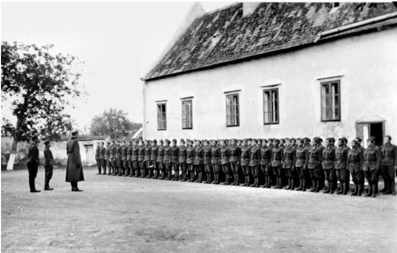
Сотня батальйона ДУН Роланд у Зауберсдорфі. Травень 1941 р.