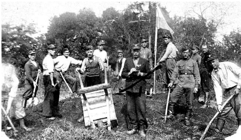
Члени ОУН насипають символічну могилу Борцям за волю України. Тучин, 1941 рік.