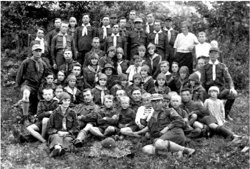
Тучинські пластуни.