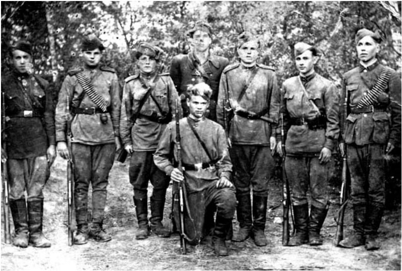
Повстанці з куреня УПА «Недолі»