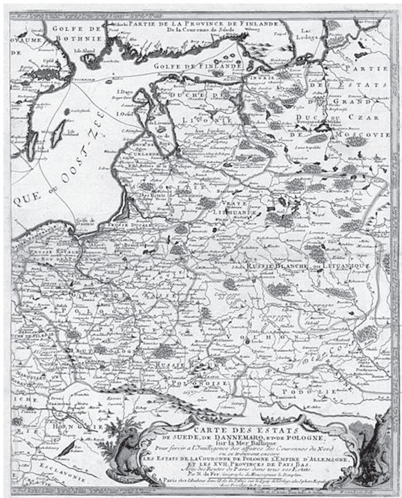
Волинь на мапі 1700 року

Під час чергового переділу Польщі в 1793 році частина земель Волині відійшла до Російської імперії. Спочатку територія була названа Ізяславським намісництвом, з центром в Ізяславі, а в 1795 році було створене Волинське намісництво, що складалося з 15 округів, з центром у Новоград-Волинському. В 1797 році губернським містом призначили Житомир, а намісництво перейменували у Волинську губернію.