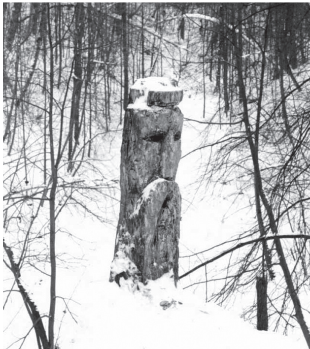
Недремний сторож священної діброви

У храмах перед кумиром головного бога жерці підтримували «вічний» вогонь, племін якого щоразу брався для розпалювання вогнищ під час жертвопринесень, для куріння пахощів під час обрядових заходів, для спалювання покійників. За погаслі багаття, поламані дерева у священних гаях жерці каралися смертю – такі випадки вважалися язичниками зловісними знаками небезпеки через гнів небожителів. Під час відзначення окремих релігійних свят (напр. Живий Четвер – Страсний Четвер у християн) племінці храмового вогню розносилися до капищ і людських помешкань. Від них запалювалися також ритуальні вогнища у священних гаях, біля рік. Поєднання двох протилежних за суттю цілющих стихій – вогню і води мало