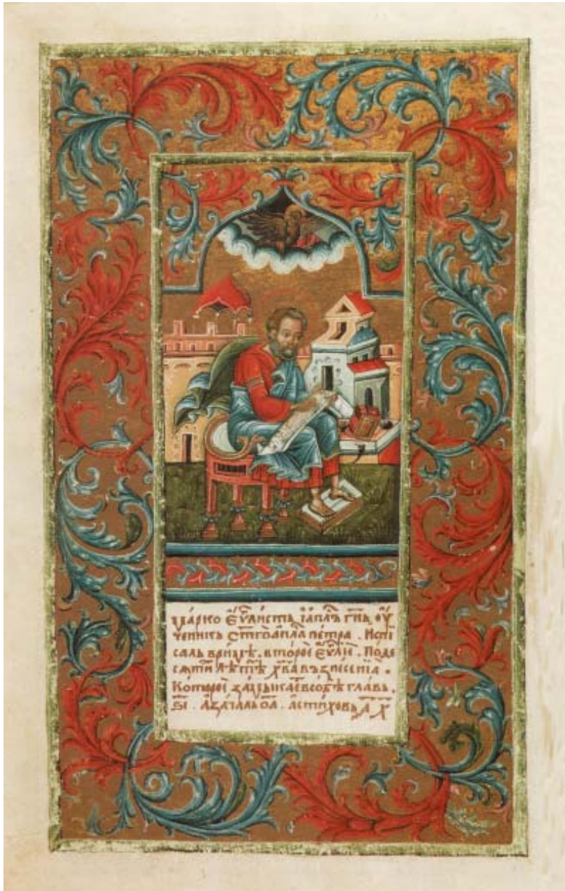
Мініатюра "Евангеліст Марко" // Пересопницьке Євангеліє... – Ф. 7.