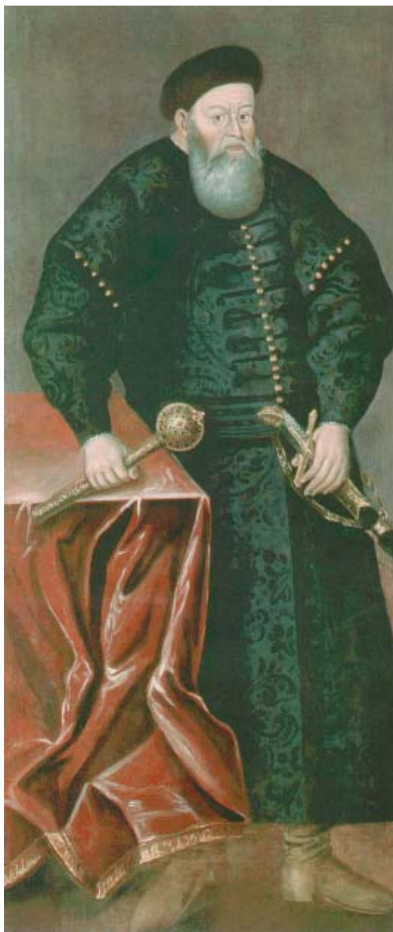
Портрет Костянтина Івановича Острозького. Невідомий художник. Копія середини(?) XVIII ст. з більш раннього портрета. Полотно, олія. 199 x 93. Національний музей історії і культури Республіки Білорусь.