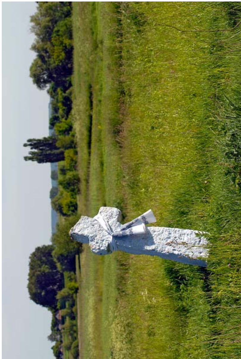
Умовне місце Пересопницького Пречистенського монастиря.