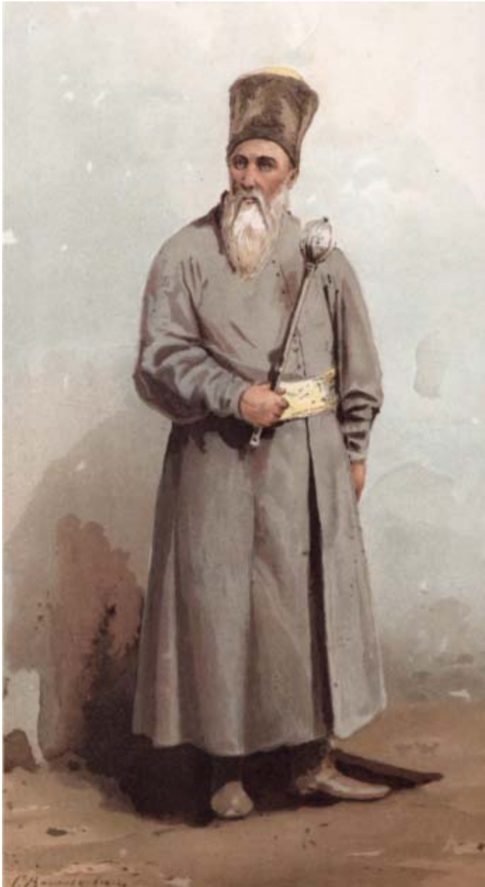
Петро Сагайдачний (мал. С. Васильківського) // Изъ Украинской старины. – С.-Петербург, 1900. – Таб. I.