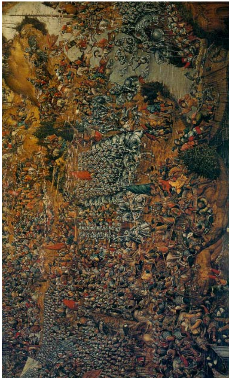
Битва під Оршею 1514. Невідомий художник XVI ст. школи Лукаса Карнака Старшого. Вроцлавський художній музеї (Польща).