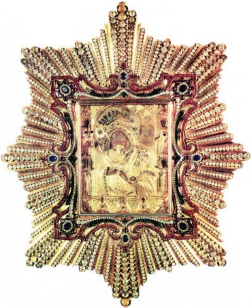
Ікона Богоматері Почаївської. Свято-Успенська Почаївська лавра.