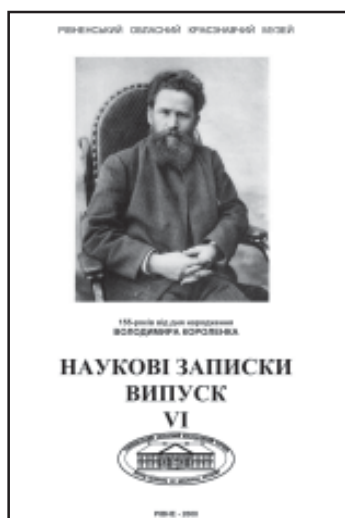
Матеріали наукової конференції. Відбулась у РОКМ у жовтні 2008 року.