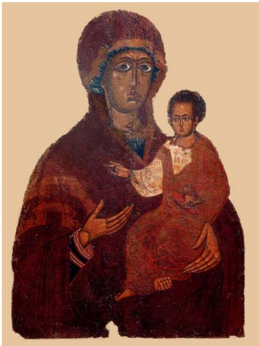
Богородиця Одигітрія (кін. XIII ст.). Зала № 21 РОКМ.