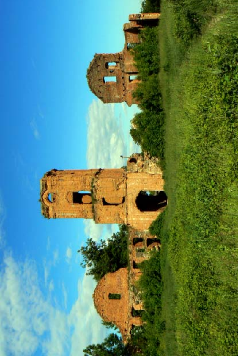
Руїни замку князів Корецьких .