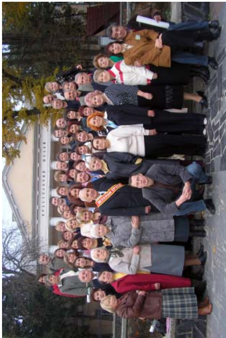
Колектив РОКМ під час святкування 100-ліття від часу створення першого музею у місті Рівне. Жовтень, 2006.