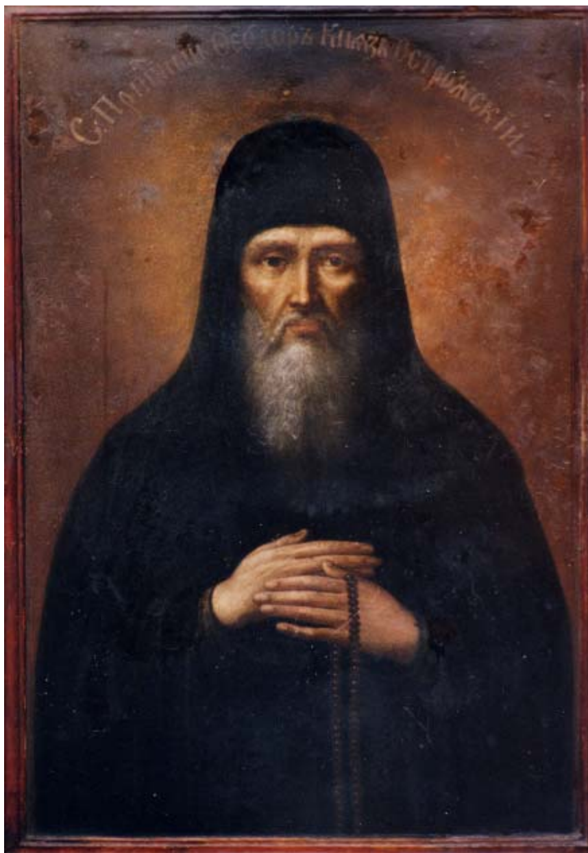
Ікона Феодосій Острозький (XIX ст.) – Державний історико-культурний заповідник м. Острог.