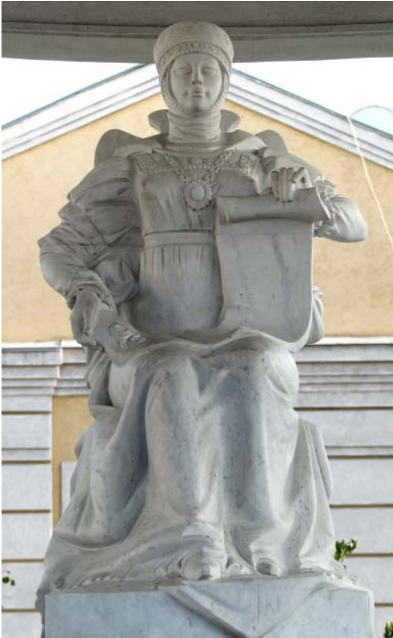
Пам'ятник Марії Рівненській Несвицькій. Скульптор В. Шолудько, архітектори М. Пасічник, М. Чабак.