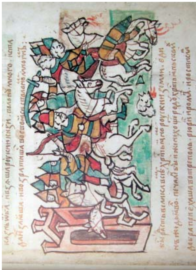
Похід Юрика Ростиславича Київського, Ярослава Всеволодовича Переяславського, Романа Мстиславича Галицько-Волинського на половців // Радзивилівська летопись... – л. 245, м. 612.