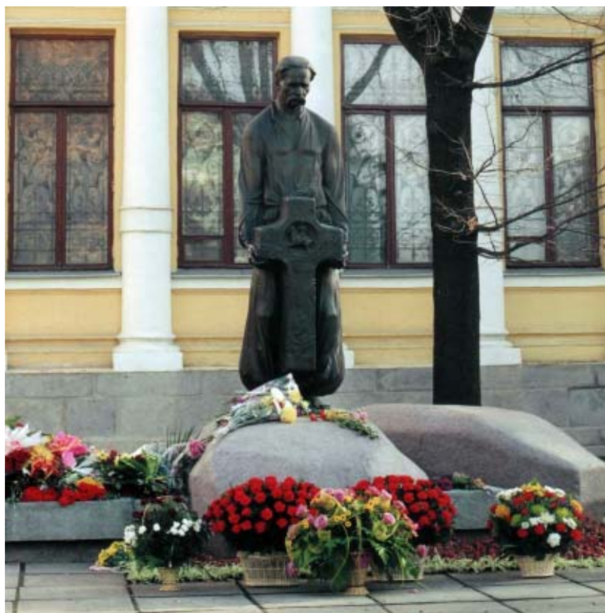
Пам'ятник на могилі Д. Яворницького. Жовтень, 2005.