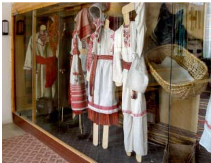
Зала етнографії РОКМ (№ 16). Автор експозиції А. Українець, В.Герасимчук.