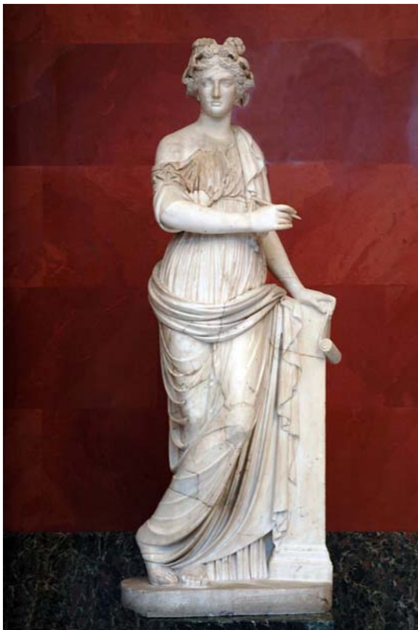
Муза історії Кліо. Ермітаж. Санкт-Петербург.