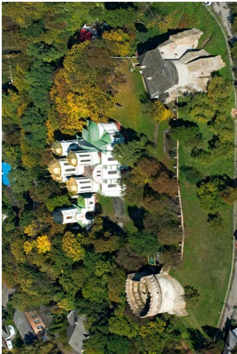
Острозький замок з висоти пташиного польоту.