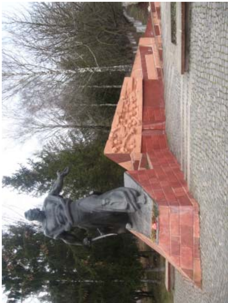
Пам'ятник Северину Наливайку. Скульптор К. Сікорський, архітектор С. Калашник. Лютий, 2009. Гусятин, Тернопільська обл.