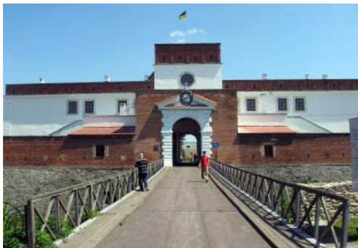
Дубенський замок. Сучасний вигляд. Липень, 2008 року.