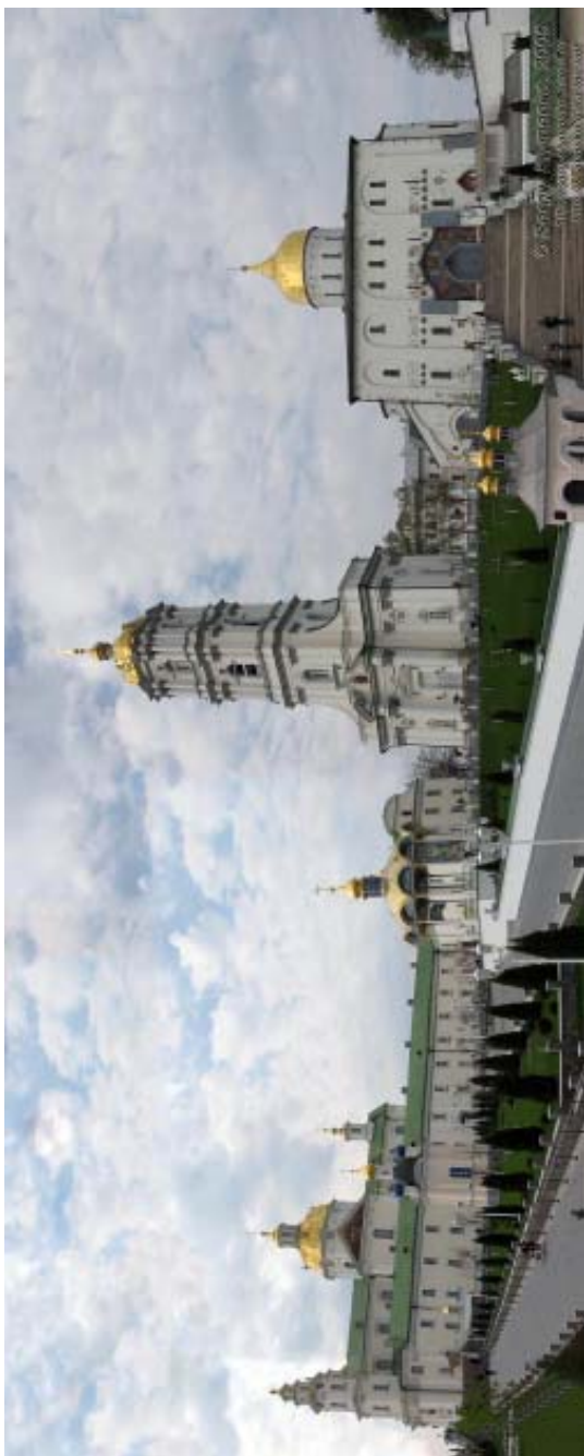
Панорама Свято-Успенської Почаївської лаври.