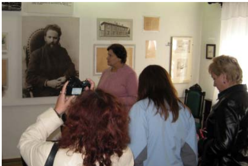
Учасники рівненської музейної конференції, присвяченої 155-літтю В. Короленка, під час відвідин музею письменника. Жовтень, 2008. Житомир.