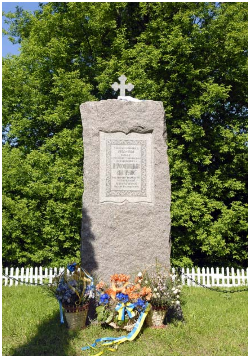
Пам'ятний знак українській Першокнизі. Рівненський р-н, село Пересопниця. Автор К. Литвин.