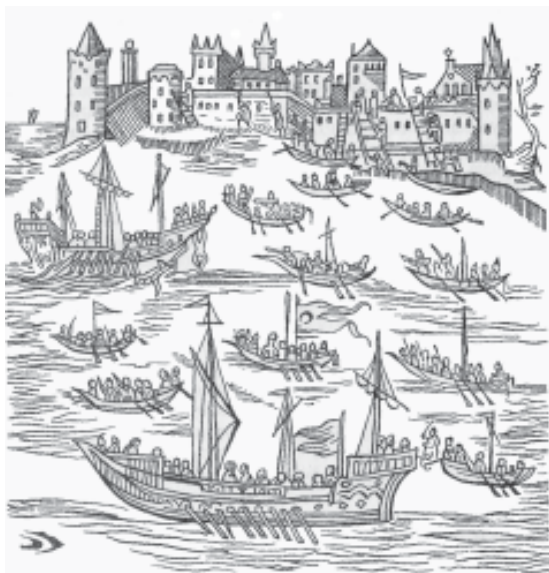
Козацькі чайки під Кафою. Гравюра (1622).

Під час походу 1575 року козаки Ружинського вперше перетнули Чорне море на своїх чайках (до того документами не зафіксоване таке), і несподівано для турків, ніби впадши з неба, почали штурмувати Трапезунд і Синоп.