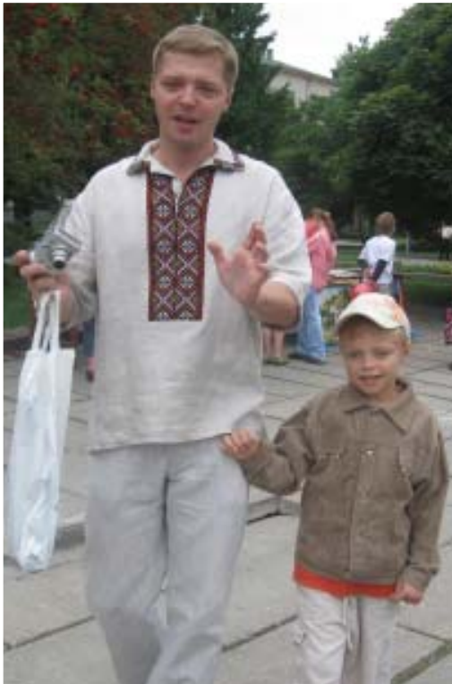
Традиційне свято «Музейні гостини». Рівненський обласний краєзнавчий музей (РОКМ). 24 травня 2009.