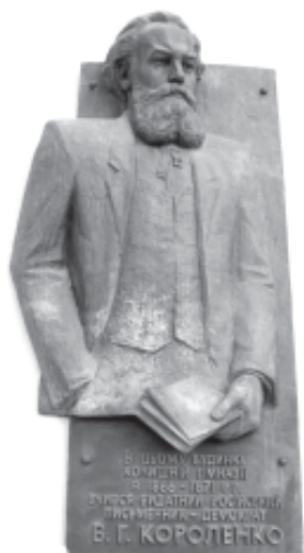
Меморіальна дошка на приміщенні Рівненського обласного краєзнавчого музею.