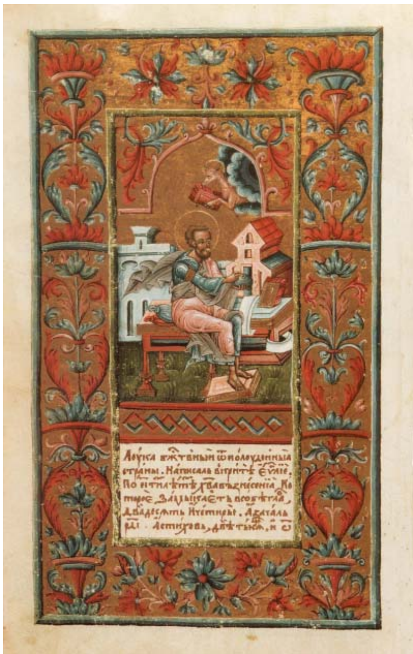
Мініатюра "Євангеліст Лука" // Пересопницьке Євангеліє... – Ф. 9.