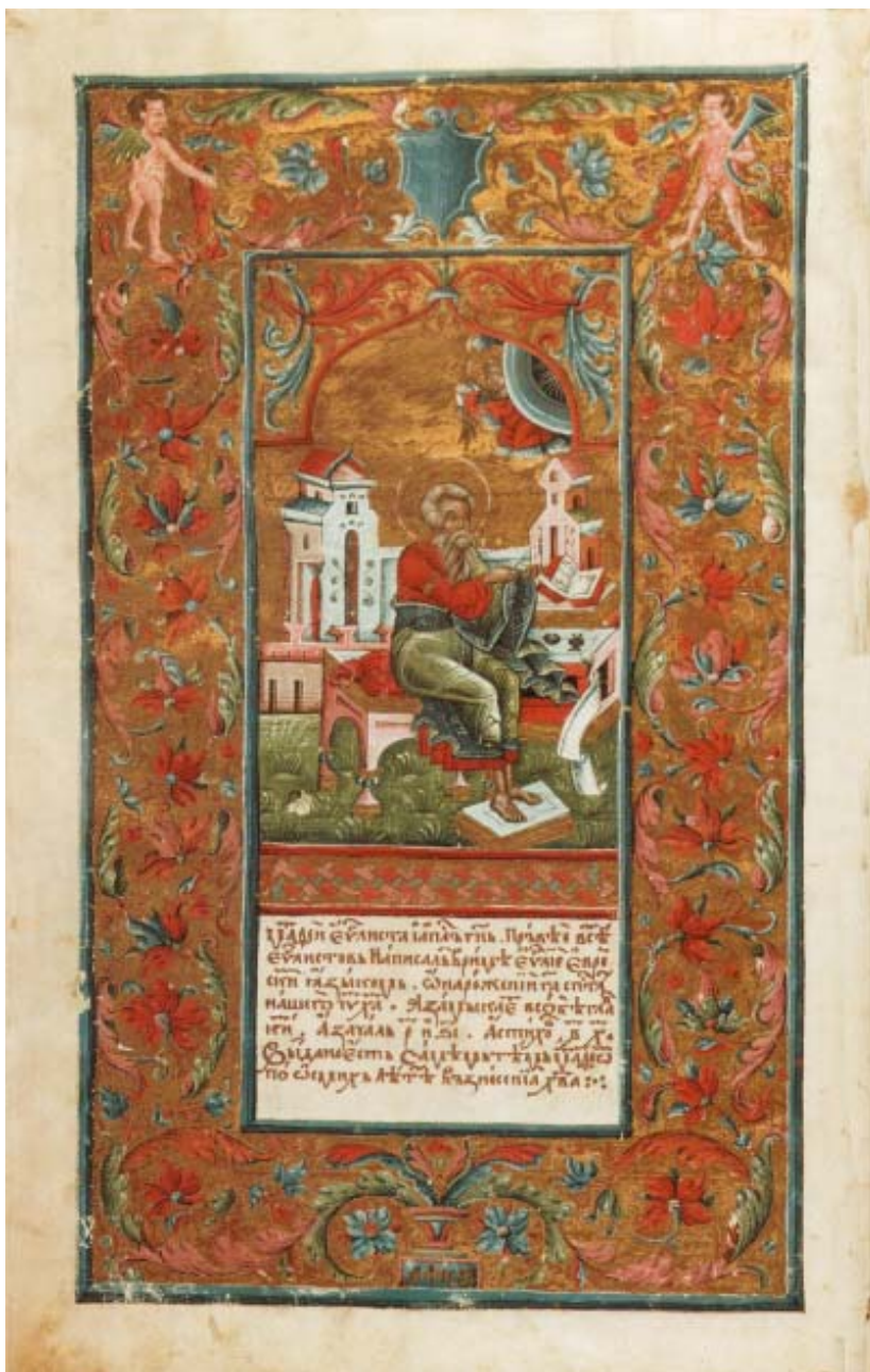
Мініатюра "Євангеліст Матвій" // Пересопницьке Євангеліє... – Ф. 5.