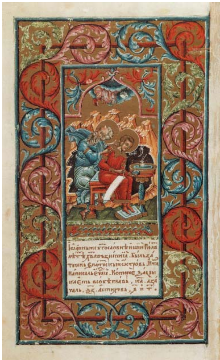
Мініатюра "Євангеліст Йоан з Прохором" // Пересопницьке Євангеліє... – Ф. 11.