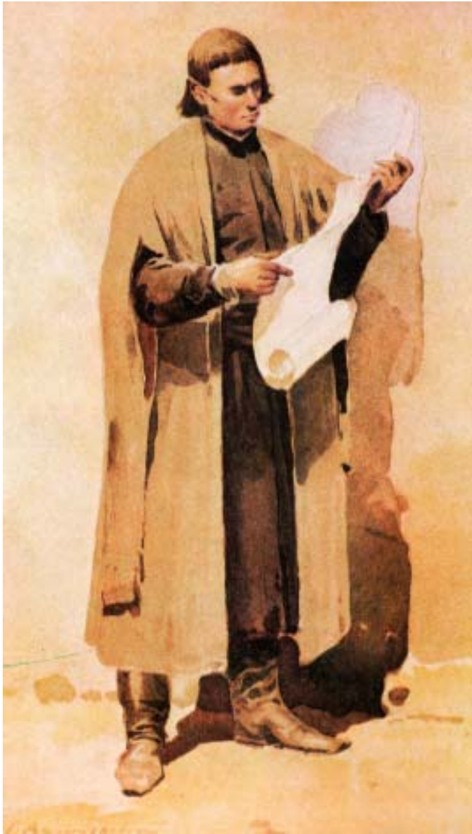
Військовий писар (мал. С. Васильківського) // Изъ Украинской старины – Таб. VII.