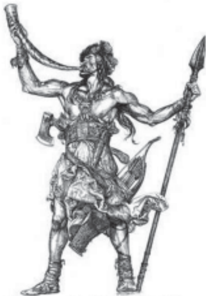
Логотип видавництва «Дуліби» (м. Київ). Автор С. Якутович.

Поблизу Володимира-Волинського у селі Зимному виявлено сліди городища, з яких видно, що у VI-VIII століттях тут було поселення з основними ознаками міста: розвинутим ремеслом, торгівлею, військовою дружиною, укріпленнями. Це одне з небагатьох відомих археологам слов'янських «зародкових міст» цього періоду. Вважають, що саме тут знаходився один з політико-адміністративних осередків дулібського союзу.