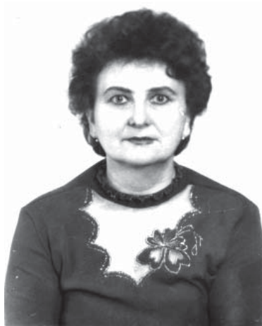
Вчителька СШ № 2 м. Рівне (1978-2000 рр.). Відмінник народної освіти України