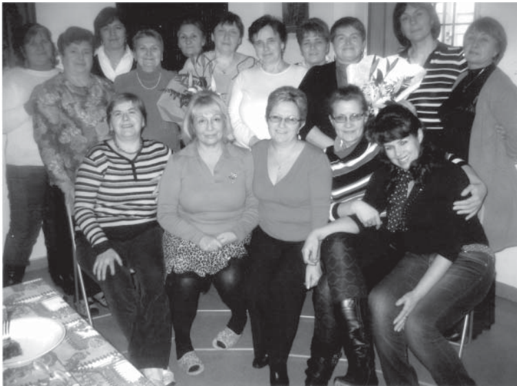
Учасники гурту «Гроно калини» у Вероні, 2010 р.