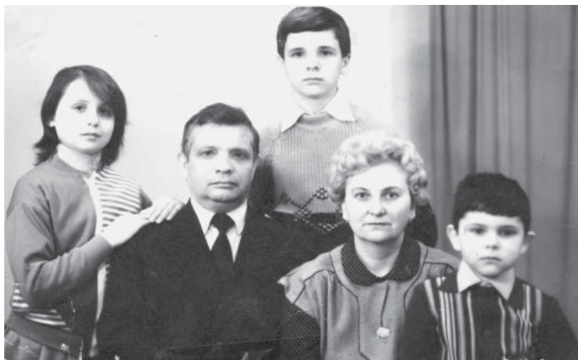
У сімейному колі, 1986 р.