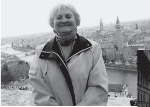
Вид на Верону, 2005 р.