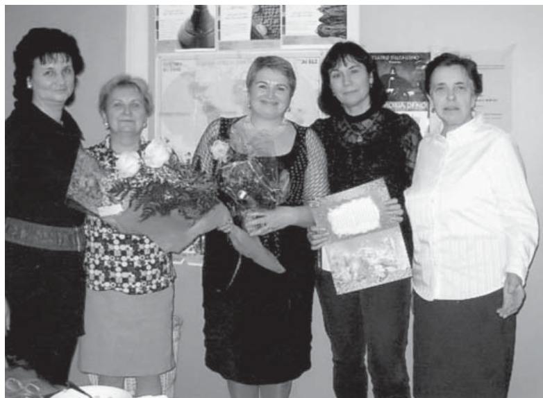
Вітання іменинниць у Вероні