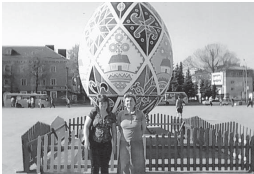
Повернення додому. Майдан Незалежності у Рівному, Пасхальні дні 2012 р.