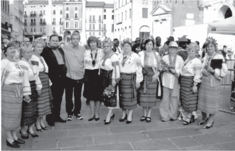
Концерт у Віченці гурту «Гроно калини» української діаспори з Верони, 2010 р.