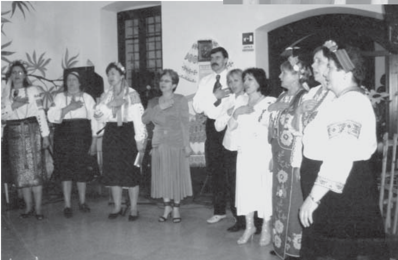
Українське свято у Вероні. Під час виконання гімну України, 2008 р.