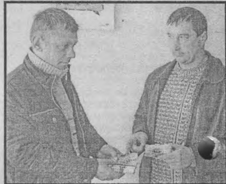
Після грози від плат захисту апаратури Новоукраїнської АТС залишилася... одна назва