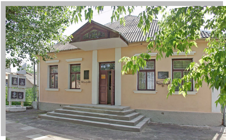
Сарненський історико-етнографічний музей