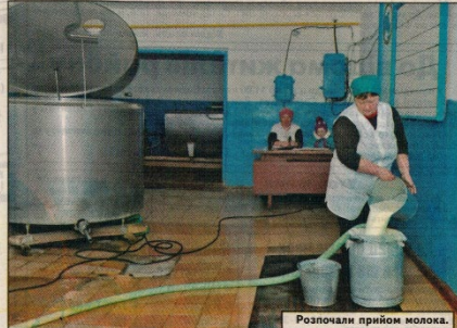
Розпочали прийом молока.