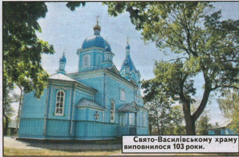
Свято-Василівському храму виповнилося 103 роки.

Тим часом у науковців своя точка зору щодо назви – камінь і його виходи на поверхню. Слово «кам'яне» підкреслює специфіку рельєфу, де залягають поверхневі та глибинні породи каменю. До того ж, біля села існував хутір Застав'я (розташований за ставом). Певно, у районі Кам'яного був великий став. Не виключено, що спочатку