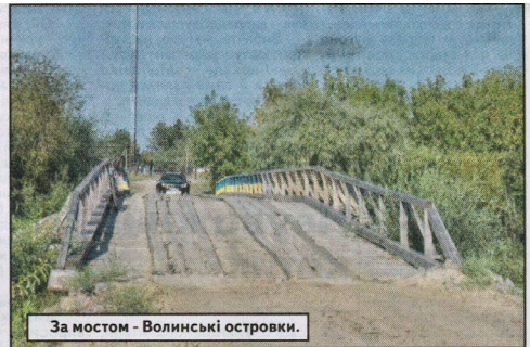
За мостом - Волинські островки.