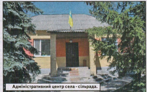
Адміністративний центр села - сільрада.

ціонуватиме (у відповідності до вимог освітнянської реформи) інклюзивний клас для школярів з особливими потребами.