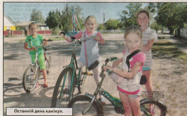
Останній день канікул.

У Кам'яне-Случанському беруть пам'ять про минуле села, про далеких предків, пам'ятають давні легенди та перекази, передають від старшого покоління молодшому. І дуже мудро чинять, адже без минулого нема майбутнього.