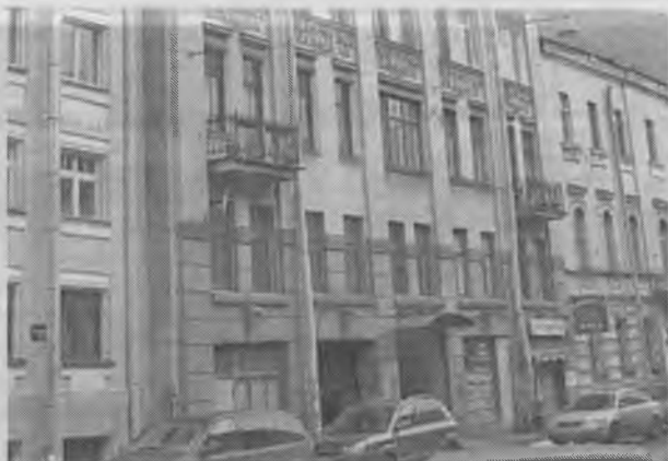
Місто Санкт-Петербург, будинок Шаї Яполутера

Невдовзі на цій ділянці пан Яполутер побудував будинок для своєї дружини, цільове призначення якого — дохідний дім, тобто будинок, квартири в яко-