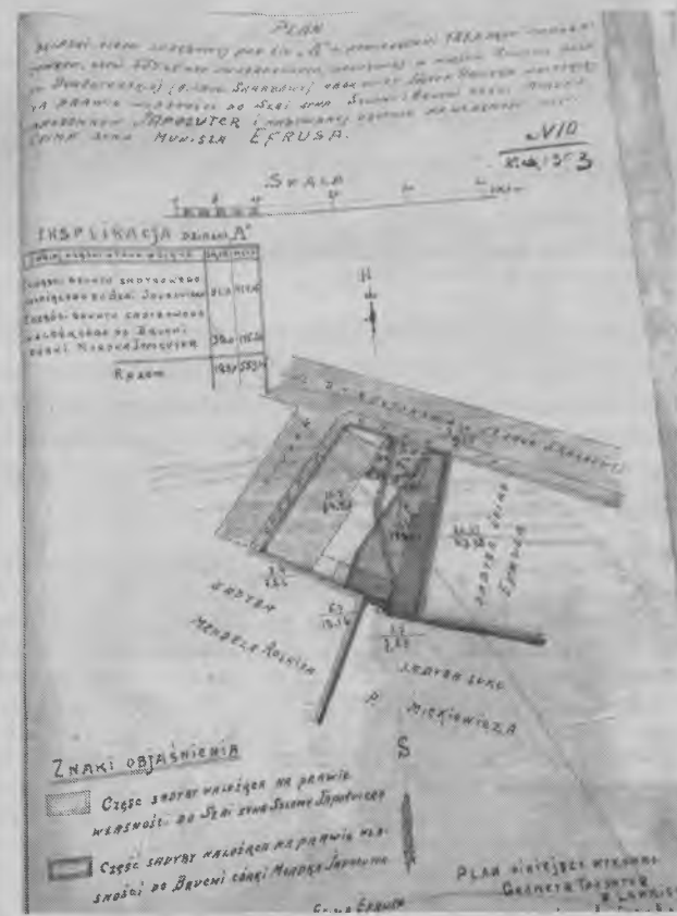
Схеми-креслення нерухомості родини Яполутерів