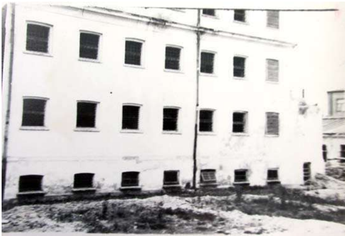
Тюрма на Соборній, фото 50-х років перед реконструкцією під швейну фабрику

До недавнього часу на стіні «швейки»-тюрми висіла меморіальна дошка, яка сповіщала, що саме тут було вбито й закатовано тисячі українських патріотів. Після продажу приміщення нові власники обіцяли, що знищувати стіну повністю не будуть, а з боку вулиці Соборної залишать нештукатурену ділянку, на якій змонтують ту саму меморіальну дошку, яка висіла тут раніше.