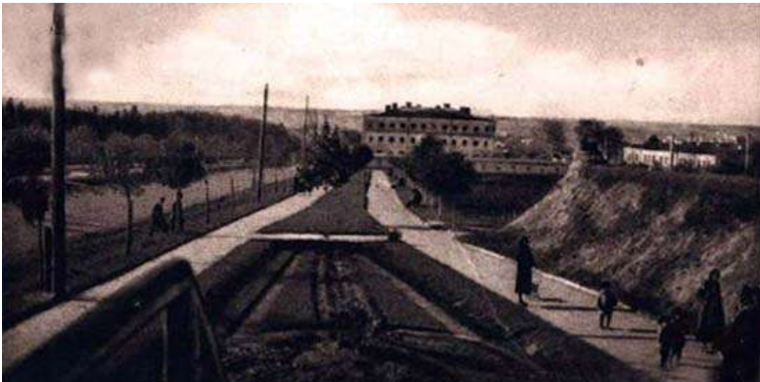
Вид на тюрму - листівка початку минулого століття, окраїна міста, видно тюремний комплекс (вид приблизно від теперішнього управління праці та соцзахисту)

Рівненська тюрма була свого часу центральною в'язницею Західної Волині. За даними польських архівних джерел, за царської Росії вона призначалася не для відбування покарань, а була головною пересильною тюрмою для кримінальних і політичних злочинців, звідки вони великою зібраною групою вирушали пішки до Сибіру. Як йдеться у архівних джерелах, навіть після побудови залізниці ув'язнених не перевозили потягом. Восени та взимку засуджені перебували у рівненській тюрмі, а навесні пішки вирушали до селища Олександрія поблизу Рівного, до річної пристані на Горині. Далі — річкою до Києва, а звідти - переважно пішки до Сибіру.