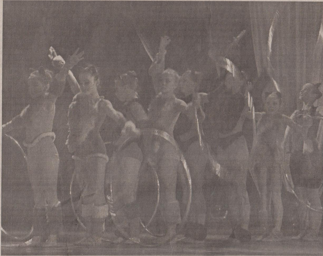
Виступ колективу “Грація” вразив не лише граціозністю, а й професіоналізмом

— З роками рівень Палацу дітей і молоді все зростає. Нещодавно був на звітному концерті творчих колективів області в палаці “Україна” в