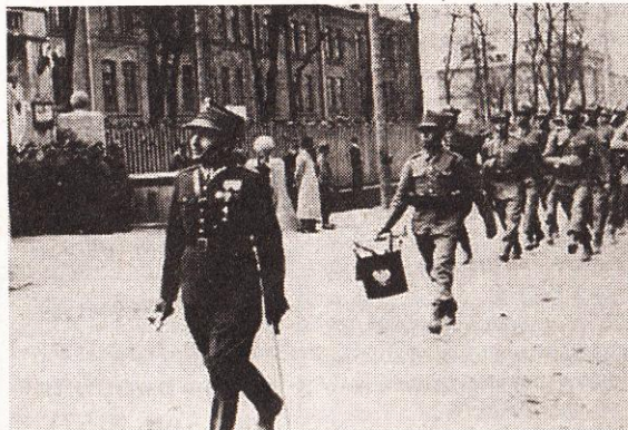
Парад війська польського перед штабом 13-ї піхотної дивізії