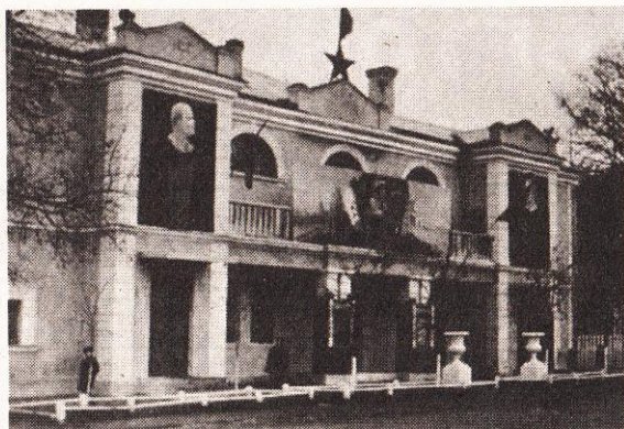
Будинок офіцерів (колишній Будинок польського жовніра) у 50-ті роки

Світлана КАЛЬКО, спеціально для сайту "ВСЕ", vse.rv.ua.