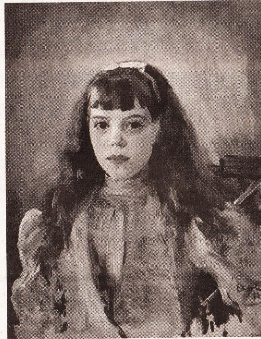
Валентин Серов. Портрет Ольги Олександрівни. 1893 рік (Ользі 11 років)

Ольга вошла в вагон. Поїхали вдвоє в її лазарет. Он был полон ранеными — 220 чел.