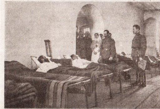
Рівно. Емператор і його сестра велика княгиня Ольга обходять поранених у військовому госпіталі.