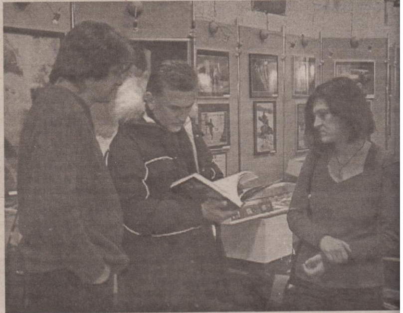
Під час презентації можна було не лише переглянути слайд-шоу з альбомом, а й погортати сторінки сигнального примірника