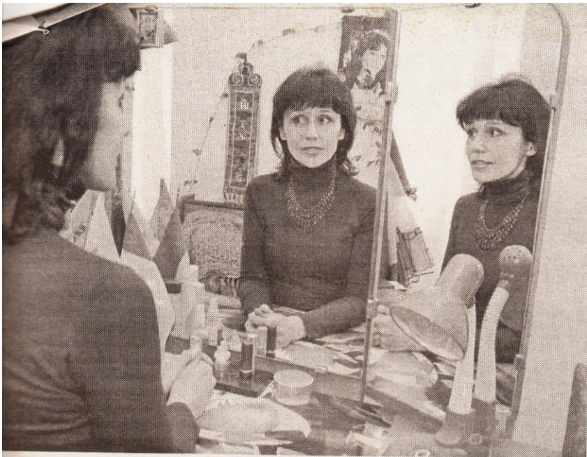
Фото О. Маршал (2)

У гримерці є все необхідне, аби налаштуватися на роль