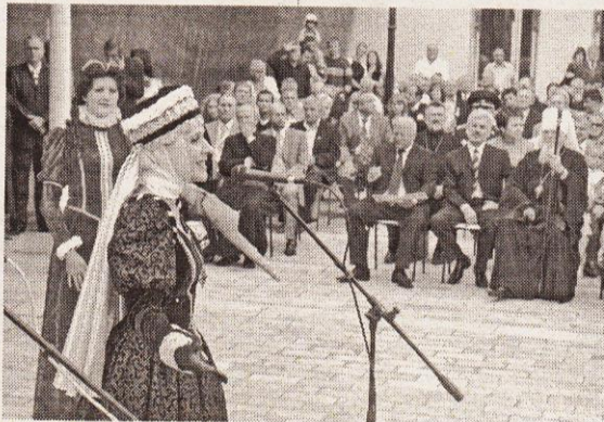
Княжна Рівненська нині гостя майже всіх міських урочистостей

чуть. Дочка, після того як подивилася "Закон" Винниченка, мовчала, аж поки не приїхали додому. А вже