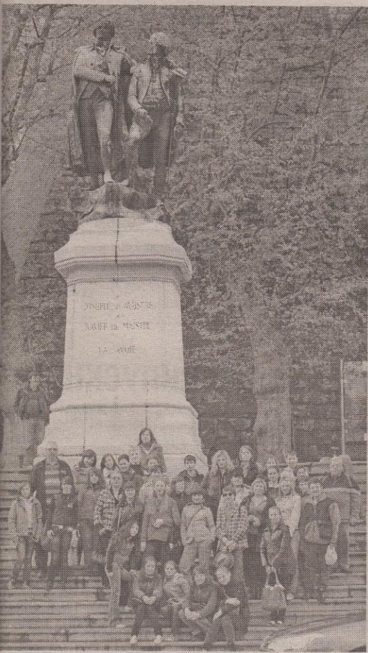
Італія. Величні пам'ятники Генуї