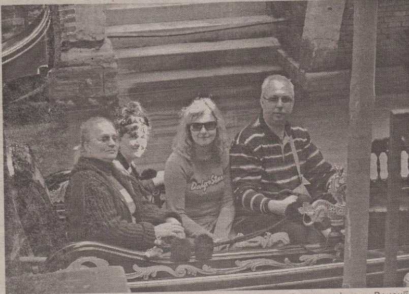
Незвіданими місцями Венеції...

— З 2004 року. Минулого року був невеличкий ювілей