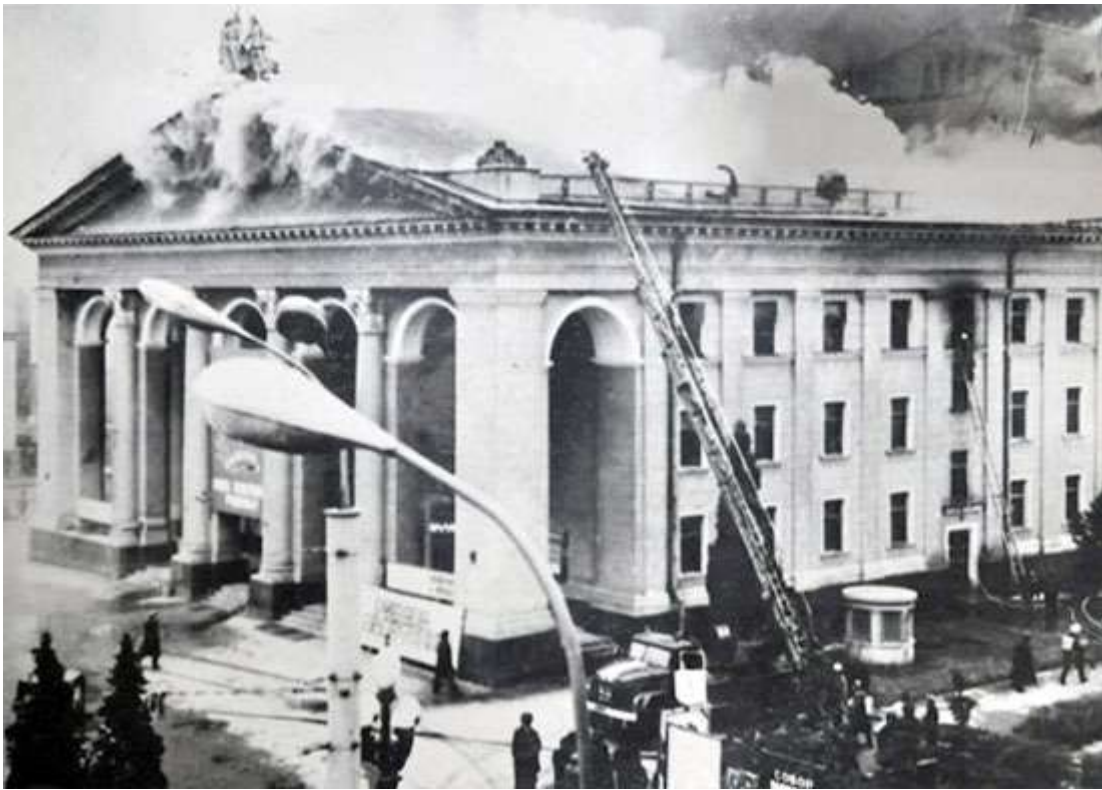
Горить театр, 5 березня 1978 року