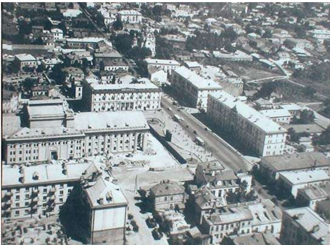
Центр Рівного і Театральна площа з висоти пташиного польоту, поч. 60-х років ХХ століття

театри кількох обласних центрів України. У Рівному пожежа сталася у день роковин смерті Сталіна. У театрі тоді якраз ішла вистава про Кузнецова “Грачов — центру”, я грав роль генерала КДБ. Прикметно, що під час пожежі в театрі вийшла з ладу дрейчерна система, відмовило електрообладнання, хоча незадовго до трагедії ми зробили капремонт, і все працювало. Актори мали свою версію щодо причин загорання, але комісія і слідчі не взяли її до уваги. “Горизонт” (завіса) був просочений легкозаймистою речовиною. Коли ми зрозуміли, що самотужки не впораємося, викликали пожежників, але чекати їх довелося довго. Намагалися опустити протипожежну завісу (це робилося вручну), але вона впала. А потім стався вибух. Мене винесло вибуховою хвилею через бокові двері. Я отримав опіки. Однак продовжував разом з акторами, які прибігли з гуртожитку, рятувати майно. Згоріли всі декорації, але наші колеги з інших українських театрів подарували нам декорації до 13-х вистав, завдяки чому ми змогли після пожежі поїхати на гастролі. Для відновлення театру знадобилося 7 мільйонів карбованців. Мені казали: “Знайнеш винних — будуть гроші”. Але головним обвинуваченим, звісно, був я. Отримав два роки умовно, потім ще довго відшкодовував збитки. Засуджені були також заступник директора і завідувач постановочної частини. Був великий тиск із боку КДБ та партійних органів. То були чорні дні для театру.