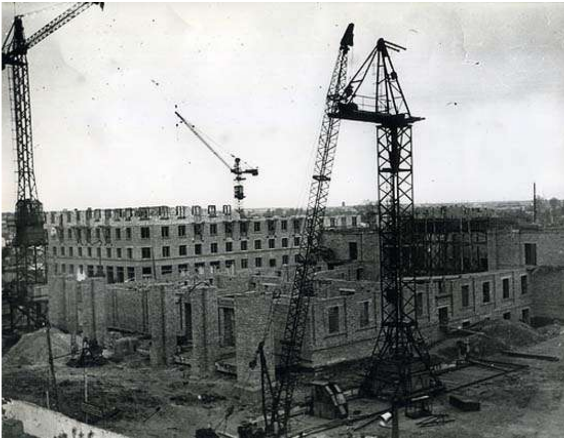
Початок будівництва театру 1958 рік

Пожежників чекали дуже довго, хоча від пожежної частини на Полуботка до театру рукою подати. Коли всі, хто був у гуртожитку на Сагайдачного, побачили, що горить театр, то одразу кинулися до службових приміщень. Через вікна викидали усе, що потрапляло під руки. Потім стали ланцюжком і передавали речі. Так врятували костюми і деякий реквізит. Актори плакали, як і більшість рівнян, що зібралися навколо. Наступного дня, прийшовши на згарище, яке ще диміло, побачили на місці амфітеатру вигорілу яму, покручені й розплавлені балкони, покороблений паркет... Звідусюди моторошно доносилося "кап-кап-кап" (усе було залите водою), відчувався ядучий запах диму, і... небо над колишньою залою...Тоді здавалося, що ми осиротіли, не могли повірити в те, що сталося. До лікарні, де лежав мій чоловік із сильними опіками, нікого не пускали, доки тривало слідство. Працівники КДБ намагалися і його звинуватити. Нервів попсували добряче. У тому, що чоловіка не стало через кілька років, не останню роль зіграла й ця пожежа.