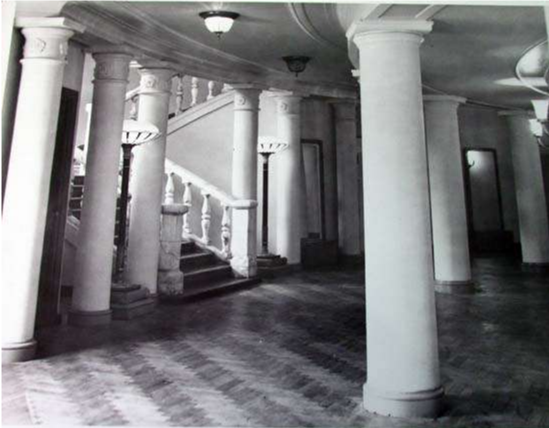
У фойє новозбудованого театру

Ми мешкали в гуртожитку, що навпроти театру на вулиці Сагайдачного. Чоловік після завершення спектаклю вийшов із радіорубки і побачив, що горить ворс на завісі. Полум'я швидко бігло угору й вогнегасником його уже загасити не можна було. Він хотів обірвати завісу, щоб збити вогонь, але вона впала на нього. Тоді він вирішив дістатися до пожежного рукава, але не добіг, бо прогрімів вибух і вибуховою хвилею його через вибиті бокові дубові двері викинуло на вулицю. Його буквально винесло на протилежну сторону дороги до колишнього магазину "Мрія". Чоловік отримав сильні опіки.