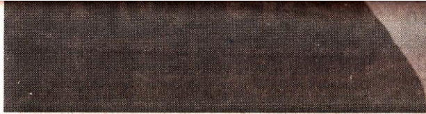
Надія Нестерук, 1972р