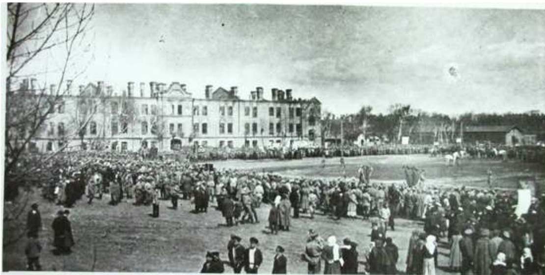
фото Василя Сала - учасника мітингу спільної маніфестації військових і рівнян 1 травня 1917 року

У квітні 1912 року на казарменному майдані влаштували небачене для рівнян шоу — містяни уперше спостерігали політ літака. Знаменитий російський льотчик Васильєв на моноплані “Блеріо” піднявся у рівненське небо.