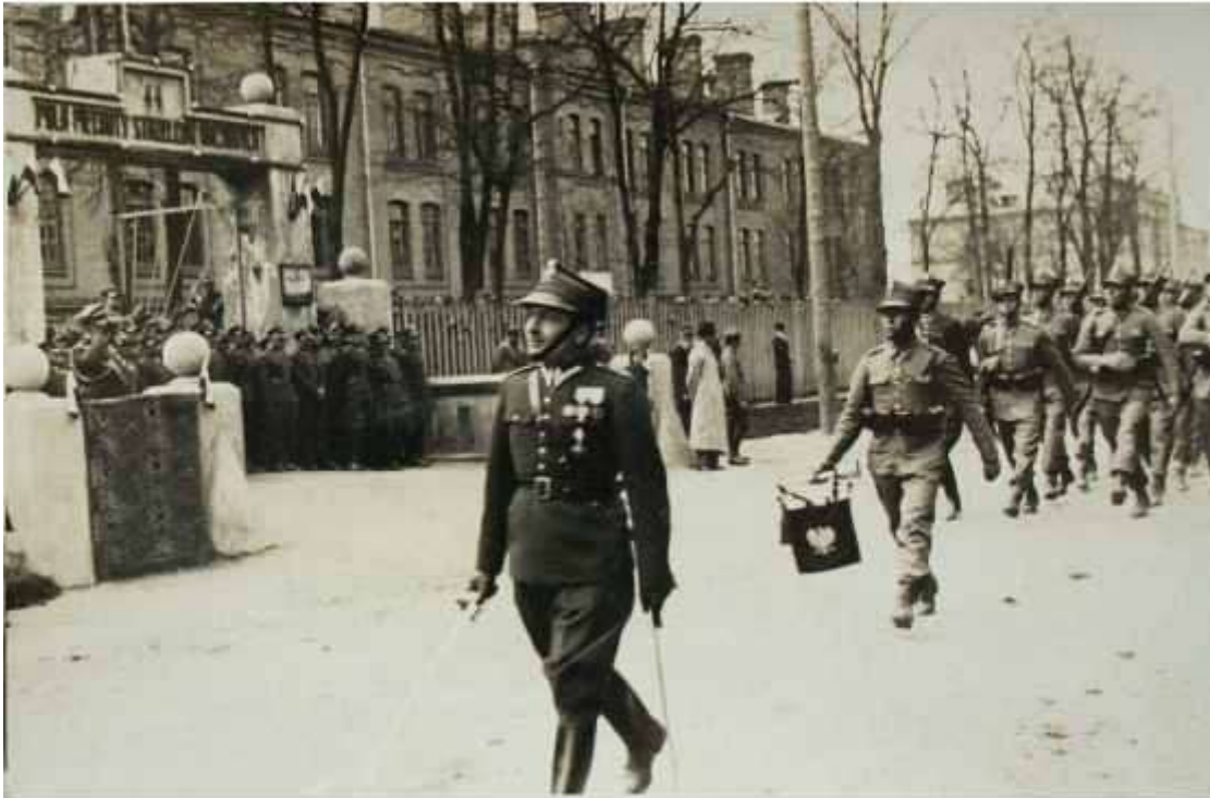
парад війська польського перед штабом 13-ї піхотної дивізії

У повоєнні роки радянська влада, цинічно впроваджуючи антирелігійну пропаганду, почала громити місцеві культові споруди. У кінці 40-х років костел замкнули. Потім там влаштували стайні для коней, згодом кінозал, а потім — гарнізонний спортзал. На першому поверсі були також кілька майстерень та меблевий магазин. Лише у 1991 році будівлі повернули її первісне призначення. Нині там знову римо-католицький костел. Щоправда, приставки “гарнізонний” він позбувся.