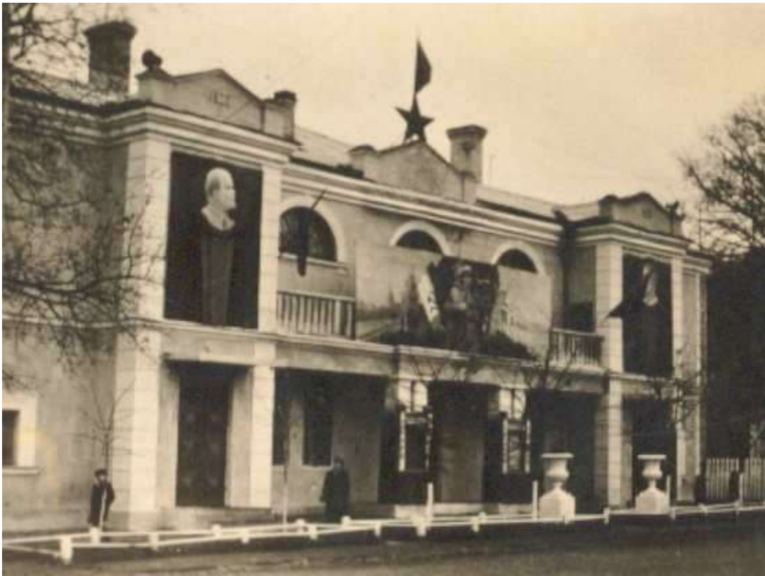
Будинок офіцерів (колишній Будинок польського жовніра) у 50-ті роки

За Польщі про відпочинок військових стали дбати в інший спосіб. Зокрема, звівши на початку 30-х років минулого століття Будинок польського жовніра імені Пілсудського. Це був осередок дозволя не лише солдатів, а й офіцерів війська польського. До речі, після встановлення у місті радянської влади заклад перейменували в гарнізонний Будинок офіцерів. Таким він залишався до середини 90-х, коли частину будівлі віддали у приватні руки під комерційний заклад, відомий як нічний клуб "Маршал". Затим приміщення переходило з рук у руки. Відтак, будинок, який багато років був окрасою військового містечка, нині являє собою спотворену неоковирними добудовами та рекламними щитами будівлю невідомого призначення.