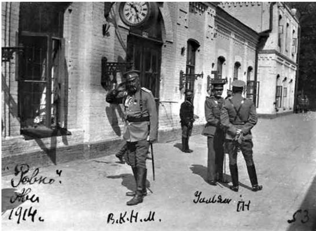
Велики князь Микола Михайлович на залізничному вокзалі у Рівному, серпень 1914 року

Активну благодійну допомогу армії організував у Рівному тодішній голова земської управи, предводитель місцевого дворянства Дмитро Андро. Він разом із помічниками налагодив постачання для війська фуражу, заготівлю сухарів, чобіт. Залишився у місті й увесь земський медичний персонал. Відтак, лікарі надавали допомогу мешканцям повіту та біженцям, уживали заходів для запобігання розповсюдженню епідемій.