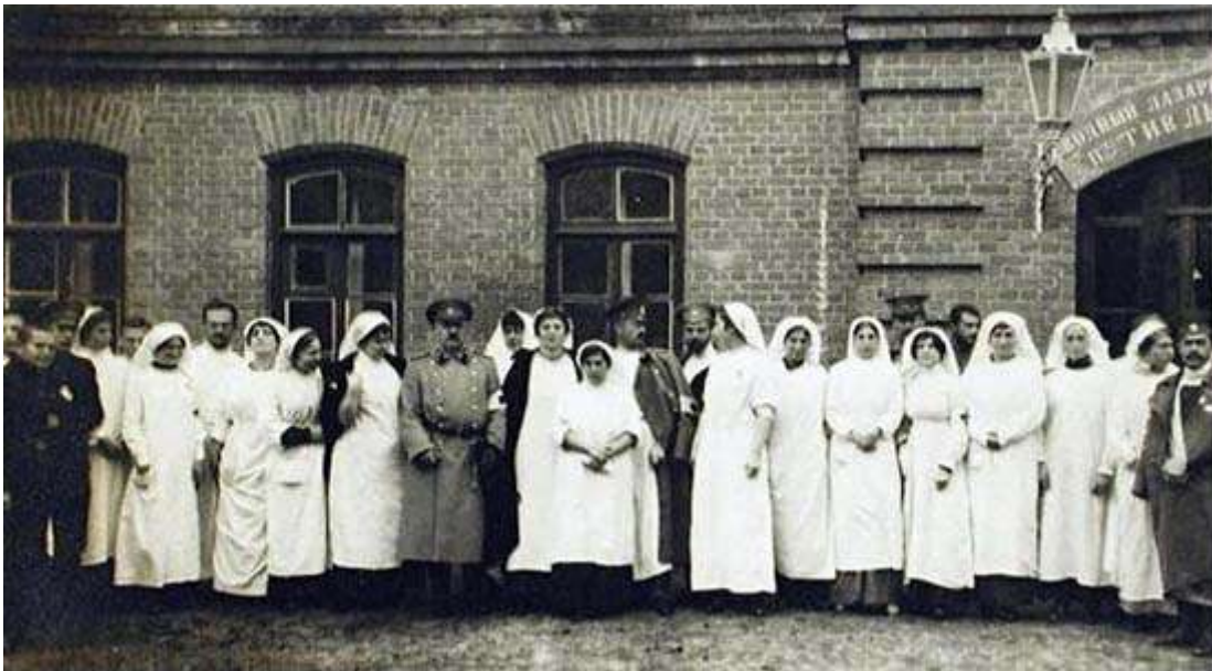
Військовий госпіталь у військовому містечку Рівного

У ніч з 16 на 17 серпня 1915 року, коли ворог підійшов до самого кордону Рівненського повіту й почався наступ на Рівне з боку Деражно, було оголошено евакуацію урядових і місцевих організацій. Евакуація проходила поспіхом, хаотично. Ще задовго до цього військове керівництво покинуло місто, поліція була бездіяльною. Тому рятувалися, хто як міг. У ніч на 17 серпня припинило роботу казначейство, й отримати кошти для вивезення майна стало неможливо. Покинуте майно і документи були розграбовані або знищені.