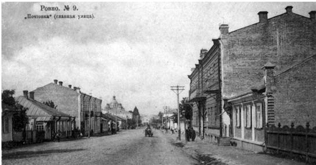
Центральна вулиця Рівного у 1914 році.

Через масове зведення до Рівного поранених з фронту, бракувало місць у військових шпиталях. Довелося військовому керівництву вдаватися до непопулярних рішень — зорганізувати шпиталі у непередбачених для цього місцях. Наприклад, у липні 1914-го за розпорядженням військового начальства розмістили польовий запасний шпиталь у рівненському реальному училищі (нинішній будинок краєзнавчого музею) та у нещодавно збудованому приміщенні жіночого училища (нині це будинок міськвідділу міліції). Однак місцеві освітяни поскаржилися самому цареві, який перебував у Рівному з візитом, і він розпорядився знайти інші більш придатні приміщення для лікування поранених. Зокрема — у незайнятих приміщеннях на території військових казарм.