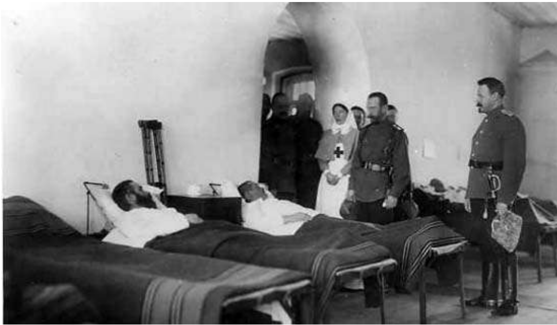
Микола II 1915 рік, цар у госпіталі - імператор російський у військовому шпиталі разом із сестрою княжною Ольгою

Про це писав сам останній імператор російський у своїх щоденниках, які дійшли до наших днів. “В половине первого ночи выехал из Ставки и в 9 час. утра прибыл в Ровно. С большою радостью встретил Ольгу и Сандро на станции. Поехал с ними в лазарет, в котором Ольга ухаживает с начала войны в качестве сестры милосердия, а затем в местный лазарет, где обошел более тяжело раненых”, - занотував у своєму щоденнику Микола II 24 вересня 1914 року. А ось як описував один з приїздів царя до Рівного часопис “Волынские епархиальные ведомости”: “ 29 октября (1914 года) город Ровно вторично удостоился посещения Государя императора. Его Императорское Величество изволил прибыть поездом ровно в 10 часов утра. Радостное и дружное „ура“ собравшегося у вокзала народа и учащихся всех училищ города встретило Обожаемого Монарха и провожало его по пути следования к лазарету. В лазаретах Государь участливо осматривал и милостиво расспрашивал больных и раненых и раздавал им награды. Видя ухаживающих за ранеными учащихся, Государь Император простер Свою милость и на них и повелеть соизволил освободить все учащихся г. Ровно от учебных занятий на три дня”.