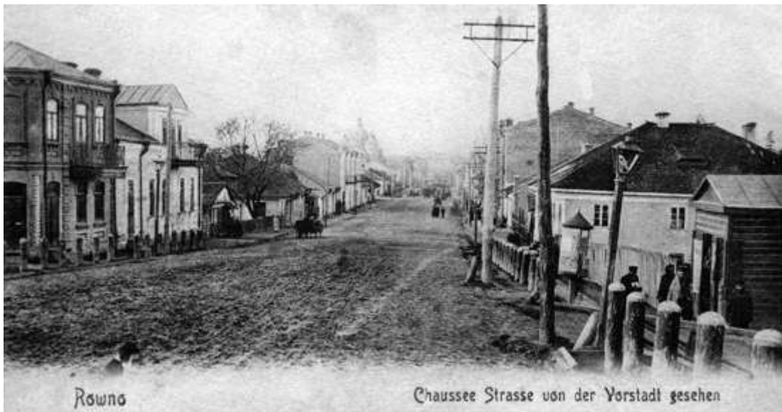
Рівне часів Першої світової, сучасна вулиця Соборна

Під час війни у Рівному працював Комітет з надання допомоги пораненим. Цей комітет опікувався не лише пораненими, а й незаможними родинами загиблих солдатів. Педагогічна рада реального училища вирішила, починаючи із серпня 1914 року, щомісячно відраховувати два відсотка із зарплатні усіх службовців закладу на потреби війська. З першого серпня 1914 року по перше липня 1916-го на потреби Комітету училище збило і передало 1 083 рублі. Учні також збирали кошти для військовиків. Наприклад, одного разу під час богослужіння в училищній церкві зібрали 76 рублів, що на той час складало майже 4-місячну зарплатню одного робітника. Збирали гроші також на утримання військово-санітарного потягу. У грудні 1914 року гімназисти організували благодійну літературно-музичну вечірку, під час якої зібрали 724 рублі й передали їх військовим. Учні реального училища та інших навчальних закладів допомагали доглядати за пораненими, які перебували у рівненських шпиталях.