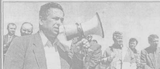
Під час міжобласного семінару.

У найближчій перспективі буде відкрито фірмовий магазин у Рівному,