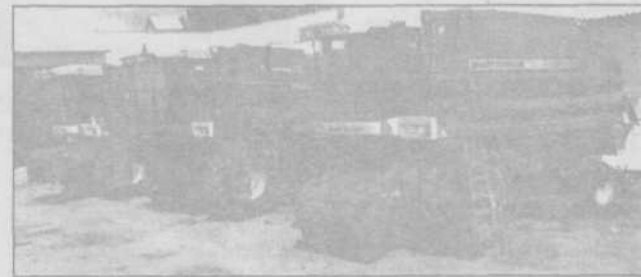
Зернозбиральні комбайни імпортного виробництва.