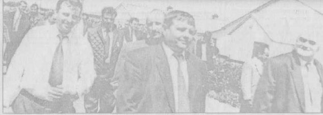
На території птахівничого комплексу на хуторі Пісок.

їдальне, видачі спецхарчування працівникам господарства.