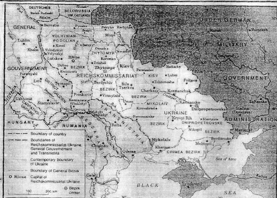
Адміністративно-територіальний поділ України за часів німецької окупації.

За невиконання цього наказу по зазначених пунктах виїні будуть