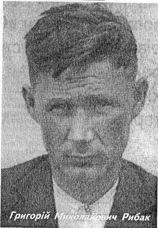
Григорій Миколайович Рибак

У травні 2009 року минає 65 років від дня героїчної загибелі, а у жовтні цього ж року - сто років від дня народження видатного діяча ОУН, колишнього головного редактора газети "Костопільські вісті" Григорія Рибак.