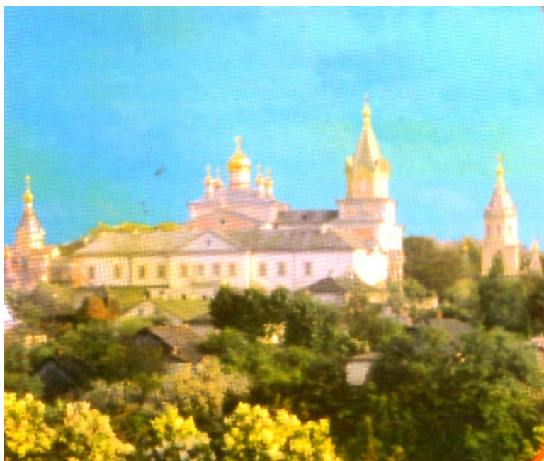
Свято-Троїцький монастир. Вигляд з північної околиці міста