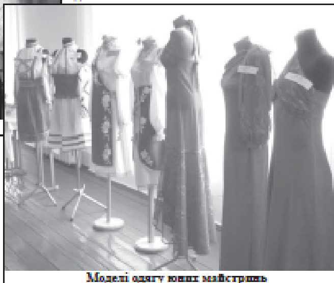
Моделі одягу юних майстринь