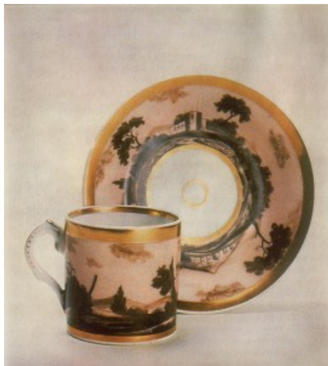
Корець. Чашка. 1810 рр.

Корець – старовинне українське місто, яке знаходиться у Житомирській області. Вперше це місто було згадано в Іпатіївському летописі в 1150 році. Тривалий час був родовою колискою князів Корецьких, після згасання роду в 1651 році місто перейшло до володінь Чарторийських.