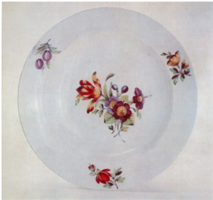
Корець. Тарілка. 1815-1820 рр.