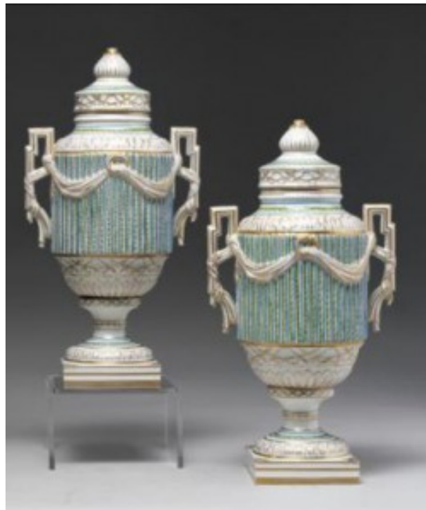
Корець. Вазы парні

Нажаль, сьогодні на антикварному ринку речі цього заводу трапляються дуже, дуже рідко. А за ціною наближаються до ціни російської порцеляни, яка вже з десяток років б'є всі рекорди продажів.