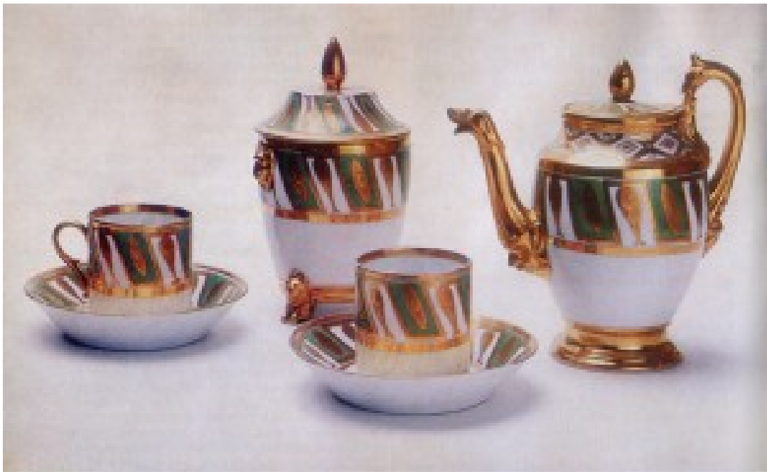
Корець. Чайний сервіз. 1820 рр.