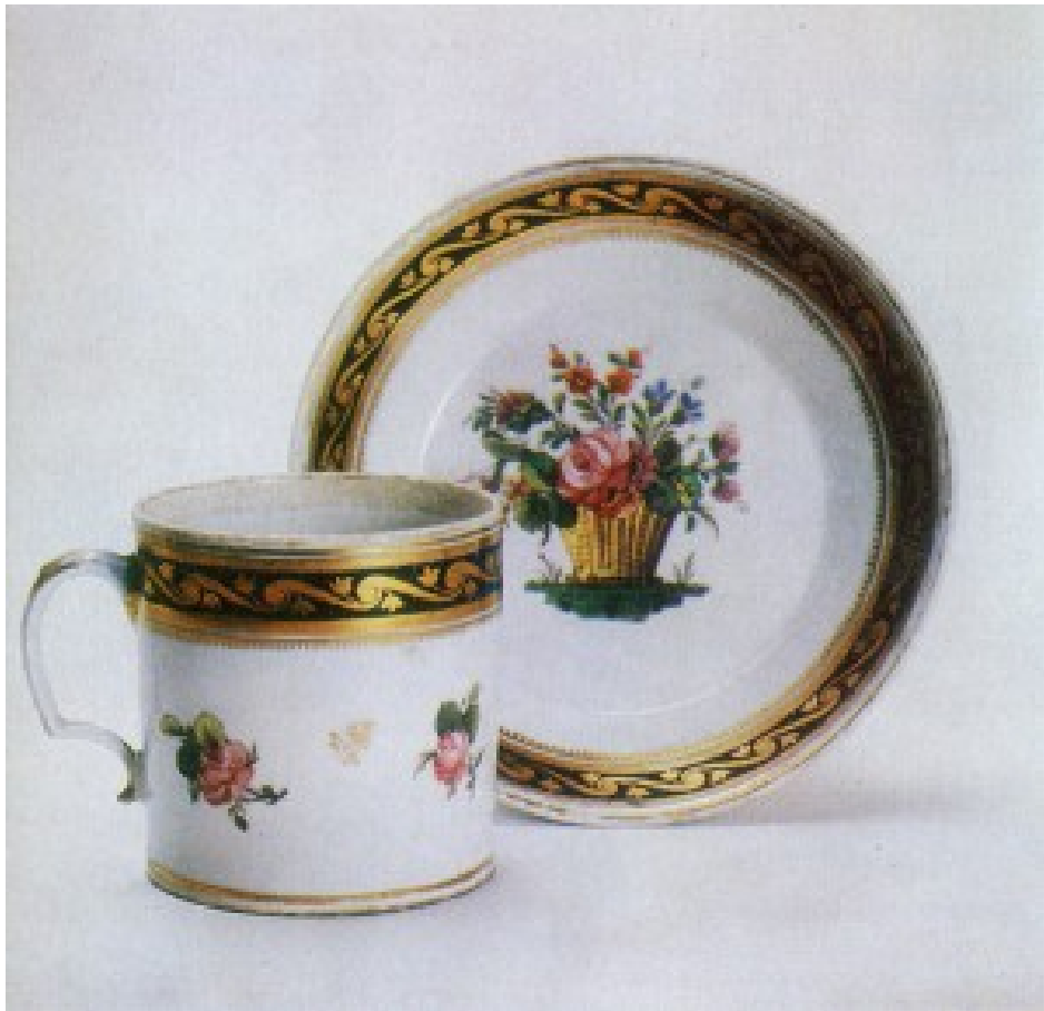
Корець. Чашка. 1790 рр.