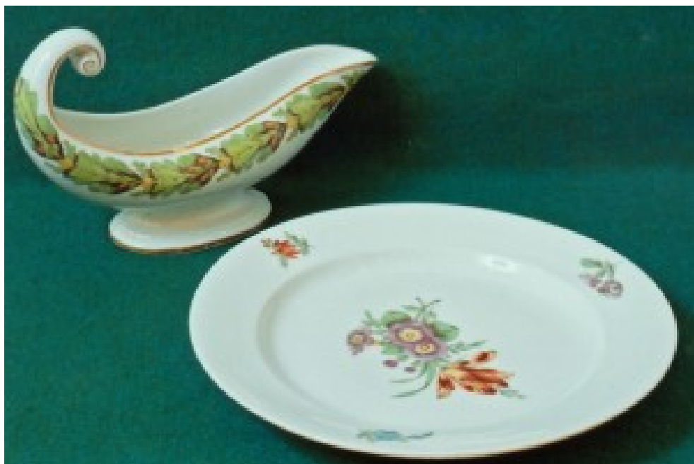
Корець. Соусниця та тарілка. 1810 рр.