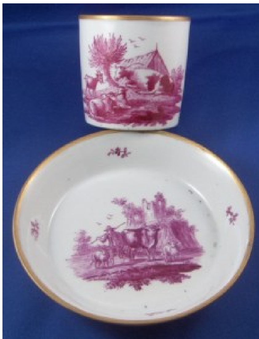
Корець. Чашка з блюдцем. 1790 рр