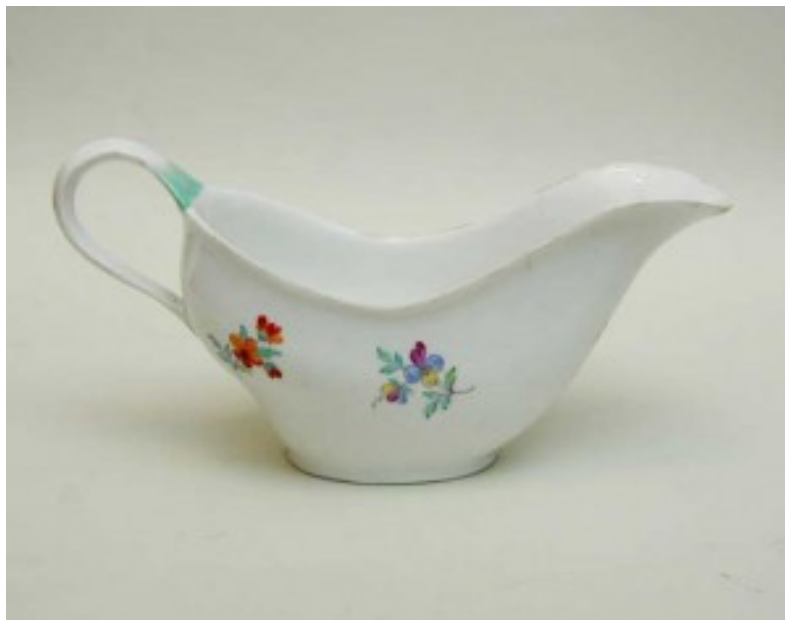
Корець. Соусниця. 1800 рр.