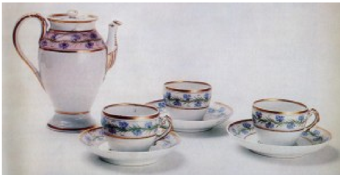
Корець. Сервіз. 1820 рр.