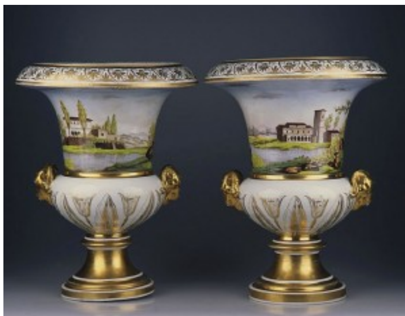
Корець. Вазы декоративні. 1820 рр.