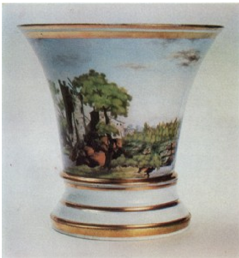
Корець. Кашино. 1820 рр.