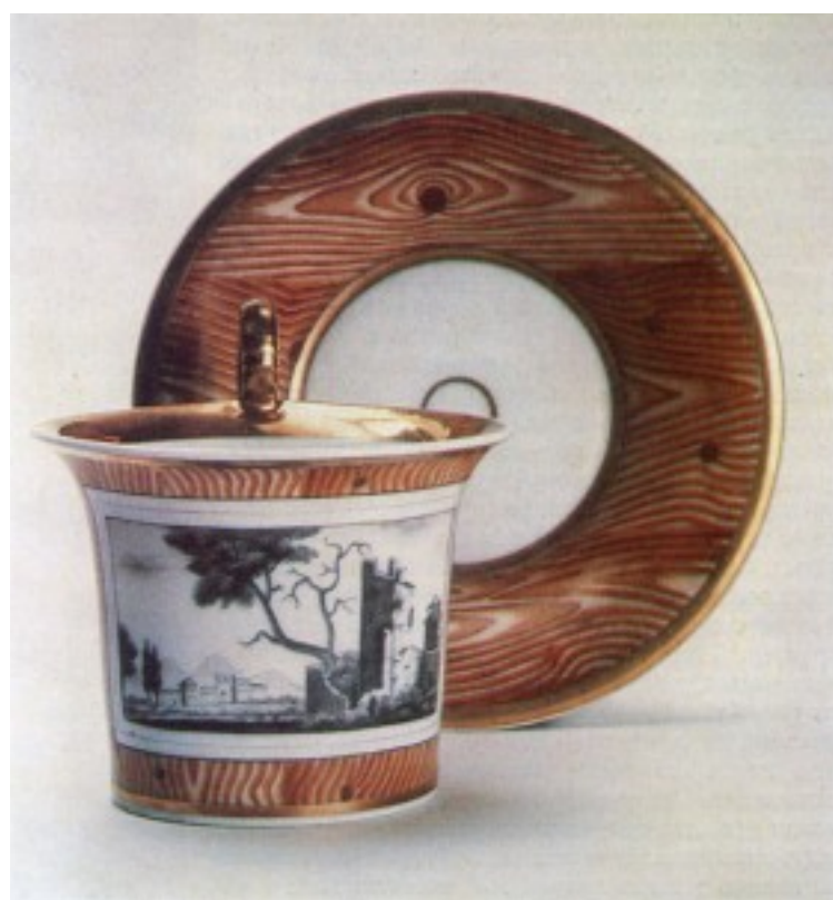
Корець. Чашка. 1820 рр.