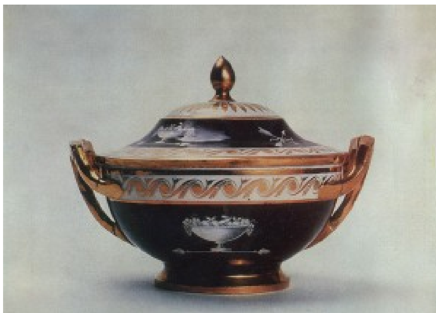
Корець. Ваза. 1810 рр.