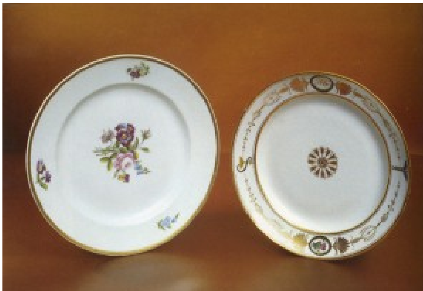
Корець. Тарілки. 1810 рр.