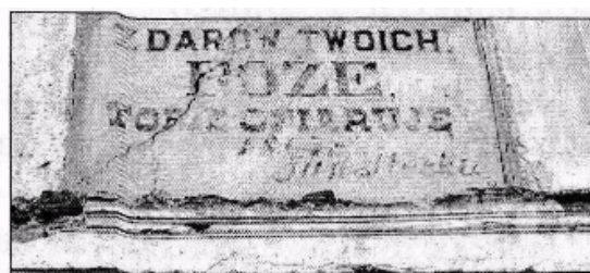
Напис на костелі «З дарів твоїх, Боже, жертвує тобі Ян Стецький, 1807».