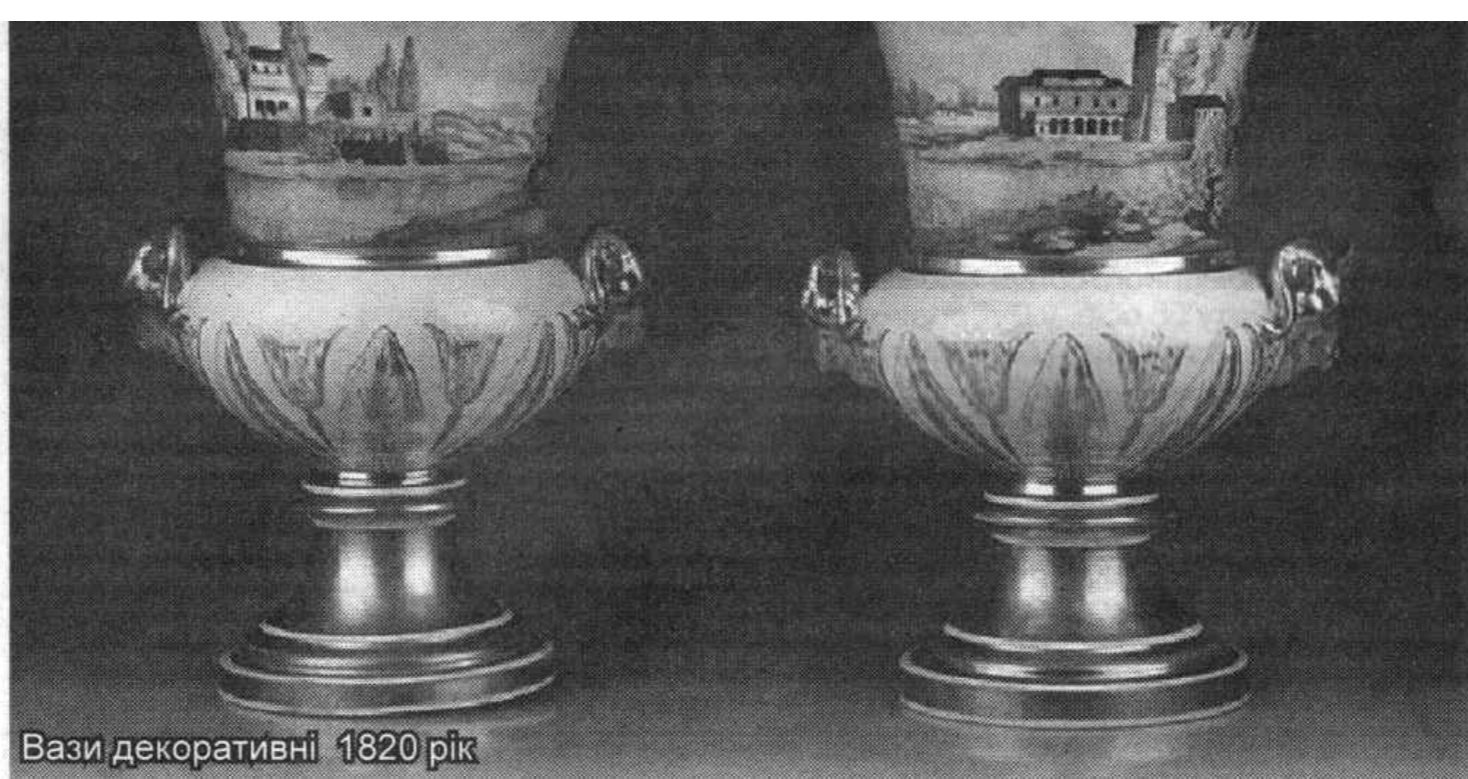
Вази декоративні 1820 рік

Продукція порцелянової фабрики користувалася попитом не тільки по всій території Речі Посполитої, але й за її межами. У її 86 майстернях (або як тепер кажуть цехах) працювала тисяча робітників. Секретом успіху корецької порцеляни була сировина, найкращого ґатунку каолінова глина, рецепт якої тримався у суворому секреті. 76 художників зображали на фарфорі види місцевих пейзажів в кольорах, притаманних саме корецькій порцеляні. Тут виготовлялися розкішні кавові сервізи, витончені мереживні підноси, тарілки, блюда і вази, прикрашені дрібними голубими квіточками на білому фоні у різних відтінках, іноді застосовували срібло, надаючи посуду неперевершений вигляд.