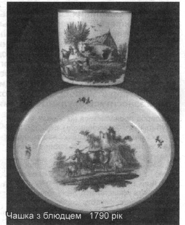
Чашка з блюдцем 1790 рік

Така ось історія нашого маленького за розмірами, але щедрого своєю