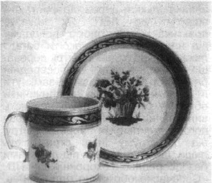
Чашка з блюдцем 1790 рік

Зрозуміло, що з занепадом фарфорового виробництва в Корці, занепало й життя Корця в цілому. Втратив своє обличчя прекрасний