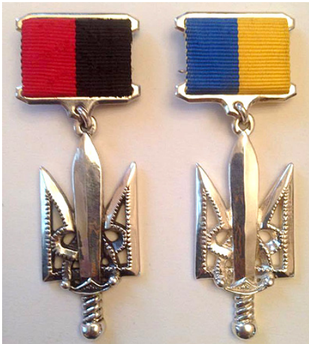
Орден «Народний Герой України»