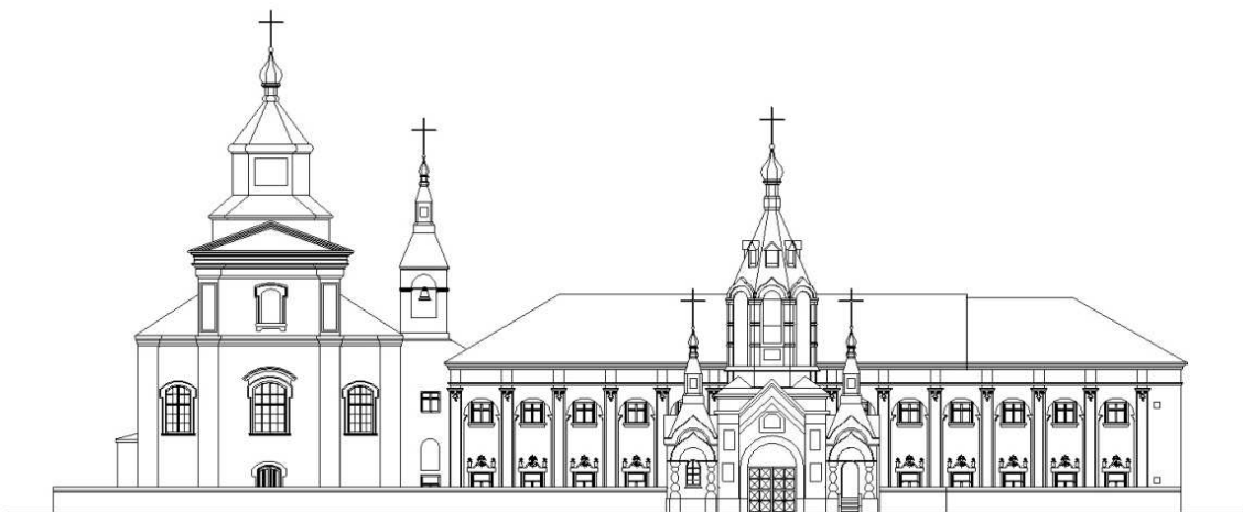
Головний фасад комплексу з надбрамною дзвіницею на початок XXст. Опрацювання автора

Монастирські споруди перебудовані назовні в основному на рівні верхніх частин. Розібраний, ймовірно, після передачі православному відомству, в 1890 році фронтон монастиря та його купол. У 50-х роках XX ст. змінено дах косяолу на чотирисхилий, фронтон косяолу розібраний.