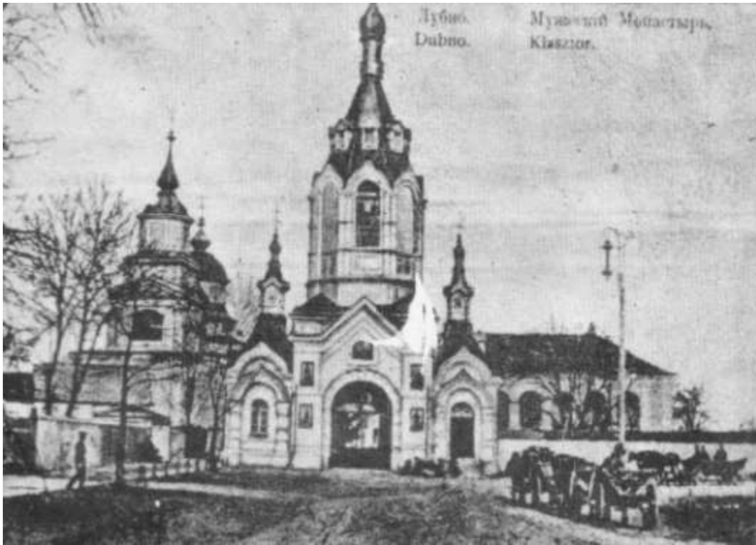
Іконографія кінця XIX – початку XX ст. після перебудови православним Відомством

Монастирські споруди перебудовані назовні в основному на рівні верхніх частин. Розібраний, ймовірно, після передачі православному відомству, в 1890 році фронтон монастиря та його купол. У 50-х роках XX ст. змінено дах косяолу на чотирисхилий, фронтон косяолу розібраний.