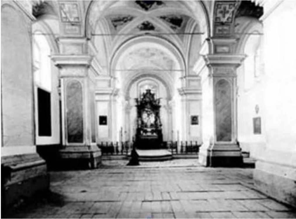
Интер'єр костелу до 1939р.