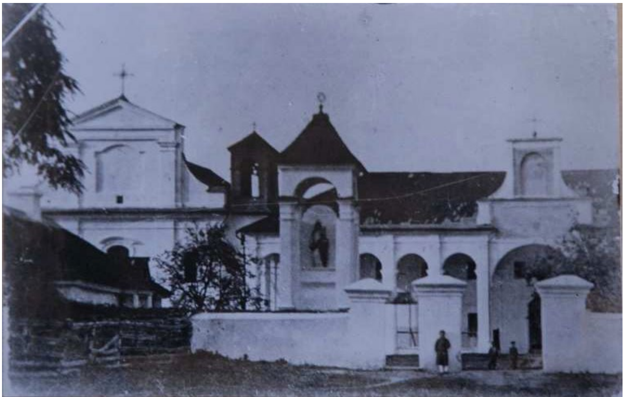
Іконографія монастиря до перебудови православним відомством. 1890-ті рр.

та побілена. До середини нашого століття з заходу зберігалися фрагменти мурованої огорожі, що пізніше була замінена металевою сіткою _2_. Сучасна брама виконана у кінці XIX – на початку XX століття. Вона зафіксована у теперішньому стані на фотовідбитку 1937 року _3_. У XIX столітті вказувалося на наявність дерев'яної брами з хвірткою. Брам у та хвіртку фланкують простінки з вигнутими завершеннями. Первісна брама втрачена. Нині перед фасадом онкодиспансеру розбитий невеличкий сад з декоративних дерев та рослин. Цей сад походить з 50-х років нашого століття. Старовинний монастир мав велику ділянку під садами та городями, що простягалися на схід і на захід від огорожі монастирського подвір'я. На початку XX століття, після того як було проведено шосе Дубно – Рівне, сад із заходу був ліквідований. В XIX столітті подвір'я монастиря та костьола було поділено на дві частини вузьким проходом, що провадив до парадного входу в монастир. Східна половина подвір'я являла собою типовий монастирський погост з фруктовими деревами та скульптурною композицією релігійного змісту. Композиція складалася з двох статуй – Богоматері, що була звернена до міста, та Ісусом – з протилежної сторони. Ці скульптури були встановлені у двосторонній каплиці,