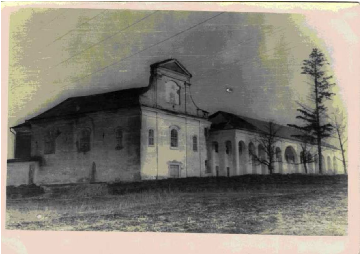
Вигляд монастиря за Польщі (фото до 1925р.)