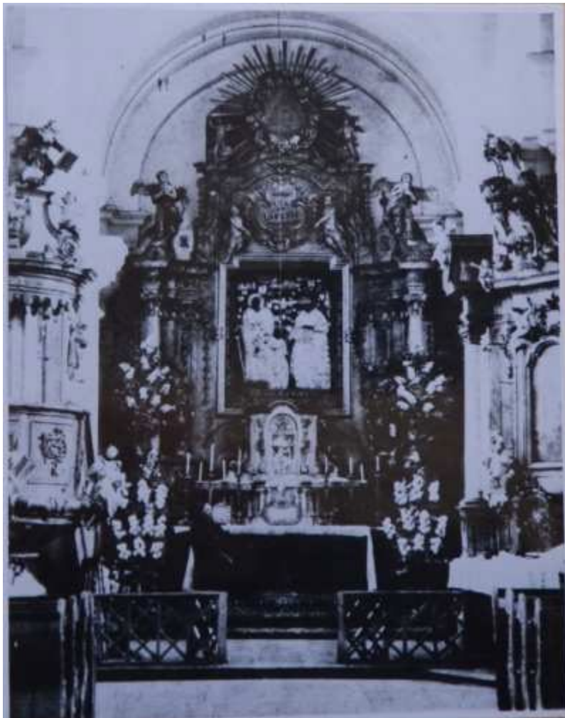
Іконостас костелу до 1939р.

В наш час інтер'єр споруди суттєво перебудований – зроблено