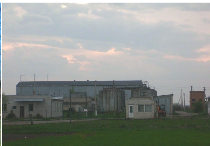
Приватне підприємство «Агрон» ( продаж мінеральних добрив)