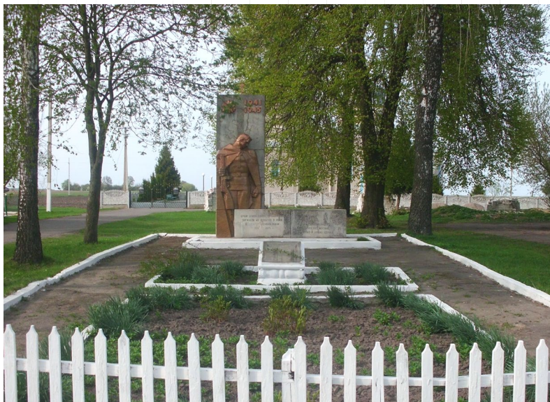
Обеліск загиблим односельчанам