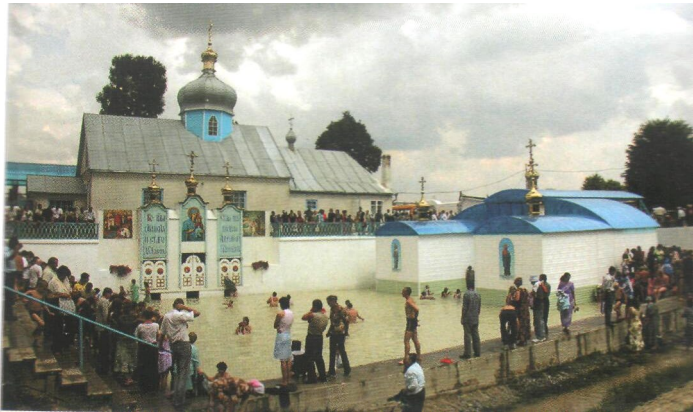
Церква та Джерело Святої Анни (с. Онишківці) нині є місцем паломництва православних християн з багатьох місць України та Зарубіжжя

В 2000- му році тут відкрився жіночий скит Свято-Миколаївського жіночого монастиря, що в селі Городок Рівненського району.