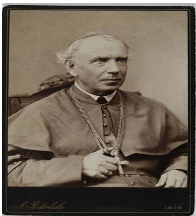
Зигмунт Щенсний Фелінський

зберігаються в Рівненському державному архіві, адже там ми бачимо багато відомих польських родів. До костелу ходили не лише католики, а й православні, адже святе слово ксьондза примиряло людей різних конфесій.