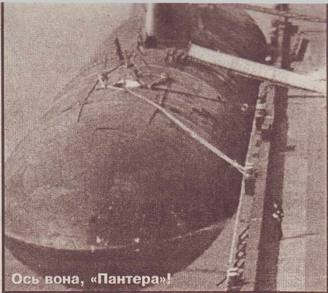
Ось вона, «Пантера»!