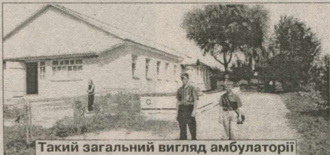
Такий загальний вигляд амбулаторії