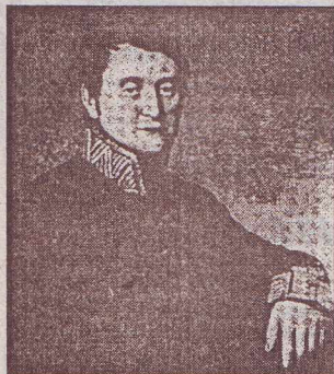
Граф Олександр Ходкевич.

Ще у дитинстві, до 1939 року, іноді батько брав мене із собою у Млинів на ярмарок, який відбувався щовівторка на вулиці і майдані біля костелу, де тепер знаходяться будинок районної держадміністрації і кінотеатр.