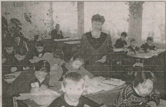
Школярі Острожецької одинадцятирічки люблять ґчителку біології, а також предмет, який вона викладає