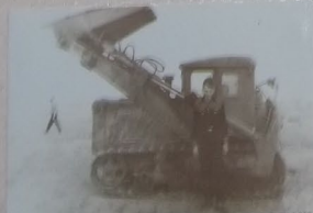
Бурий Петро, житель с. Біле працює на комбайні в полі 1967р.