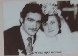
Наїм'ять про весілля