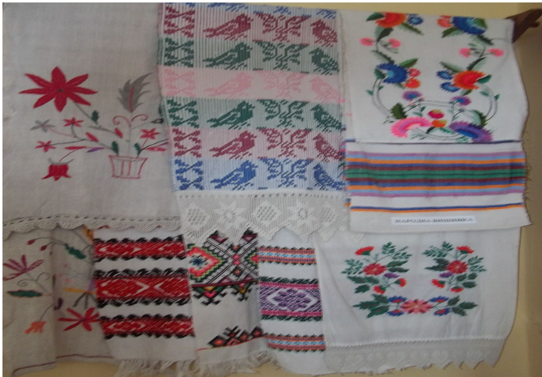
Зразки народної вишивки