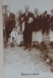
Йдуть в святі