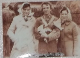
Дівчата с. Біле 1978р.