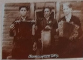
Школяри с. Біле 1978р.