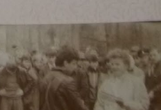
Учась учнів Білоуської школи з гри «Вривіть»