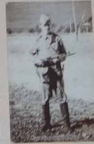
Служба в армії 1964р.