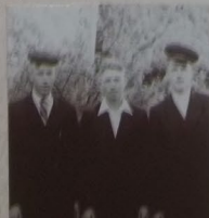
Стенд «Село Біле в 60 – 80-х роках»