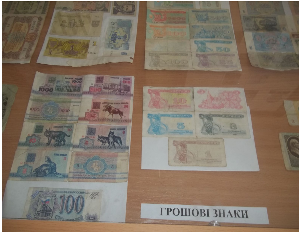
Зразки грошових знаків