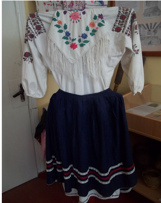
Традиційний селянський святковий одяг