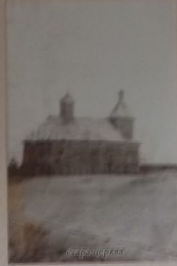
Школа с. Біле