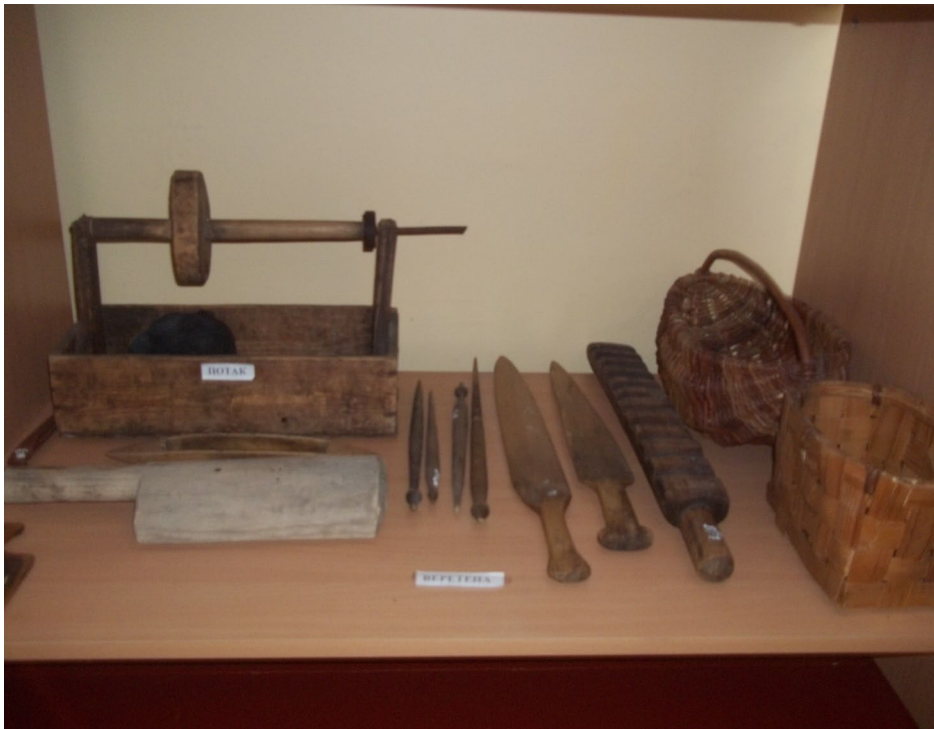
Зразки предметів селянського побуту