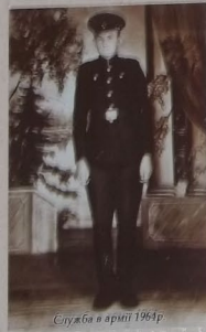
Служба в армії 1964р.