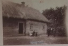
Дом с. Біле