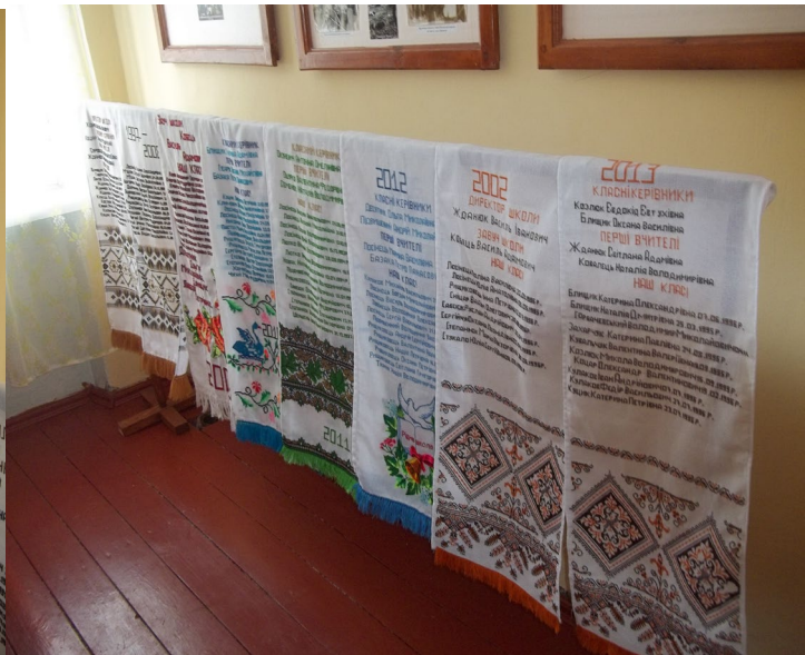
Шкільна форма радянських часів. Вишиті рушники, подаровані школі випускниками.