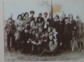
Привітання Армії 1978р.