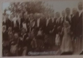
Школа с. Біле 1978р.