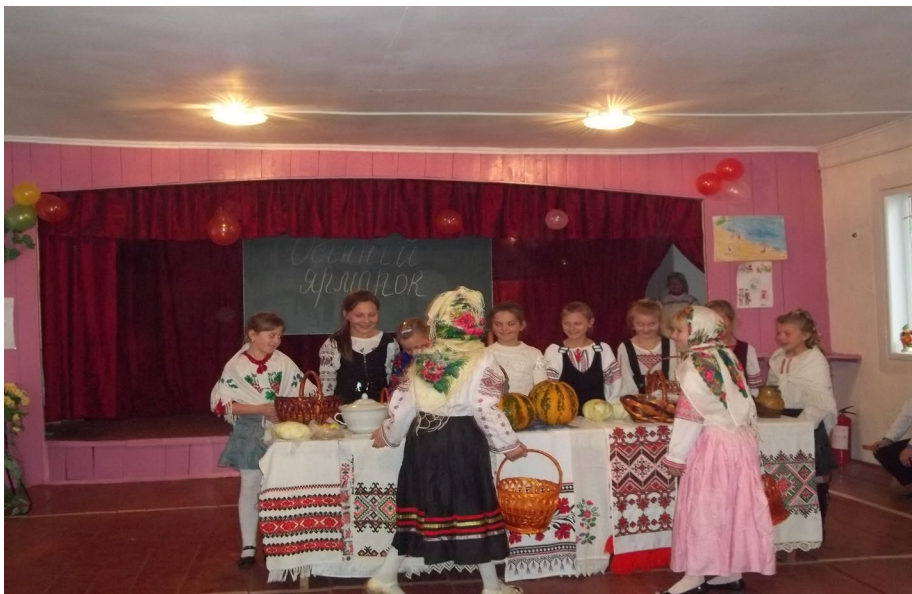
Використання краєзнавчого матеріалу на шкільному святі «Осінній ярмарок»

Краєзнавство всебічно розвиває світогляд учнів, прищеплює їм дослідницькі навички. Завдяки краєзнавчим спостереженням відбувається активне засвоєння учнями навчального матеріалу і набуття ними навичок, необхідних у житті. Стрижнем краєзнавчої роботи учнівської молоді є прагнення молоді зберегти і примножити звичаї, традиції і обряди українського народу. Краєзнавчі матеріали, віднайдені юними краєзнавцями, знаходять своє місце в шкільних музеях, які є центрами виховної роботи у школі.