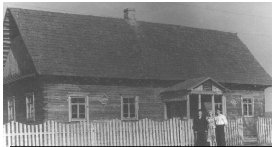
Приміщення школи в 50 – ті роки

В 1950 році пройшло укрупнення сільських рад внаслідок чого сільську раду села Бишляк було об'єднано з Великотелковицькою.