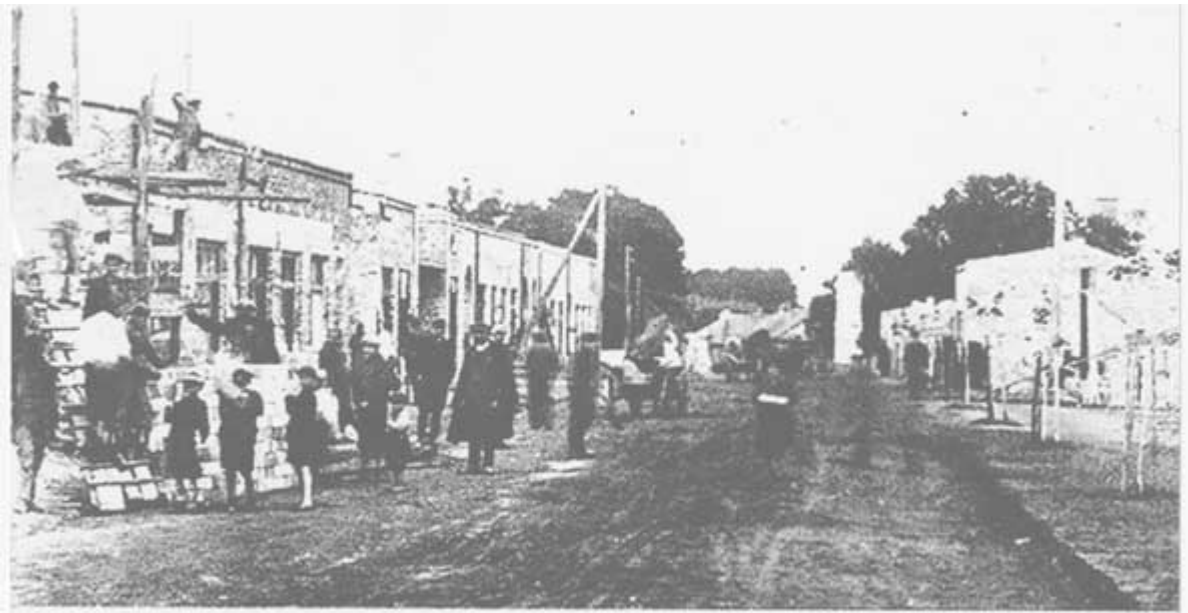
The township (main street) rebuilt after the 1934 fire (Pogrom attack) תעירה בכנינה לאחר הדליקה