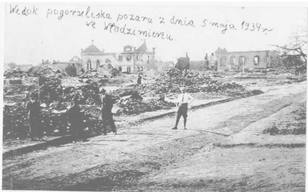
Government council evaluating the damage of the fire in 1934 after the Pogrom attack

הוועדה הממשלתית להערכת נזקי הדליקה ב־1934