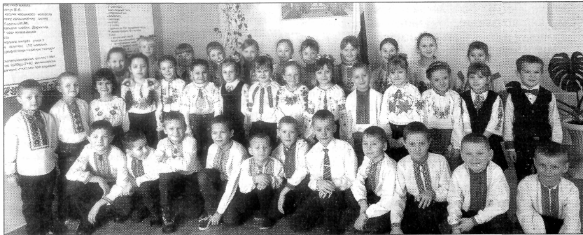
У наймолодших балашівських школярів настрій чудовий.