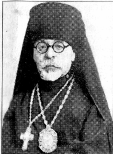
Іван ОГІЄНКО — митрополит УАПЦ Іларіон.

винна проводитись виховна робота по національних і державотворчих напрямках. Вояк без програми піде за брехливою пропагандою, як це сталось в 1917 – 20 роках, а озброєний політичною платформою буде твердо стояти на засадах суверенної держави».