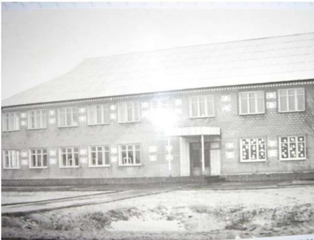
Новобудова Курганської ЗОШ 1981р.