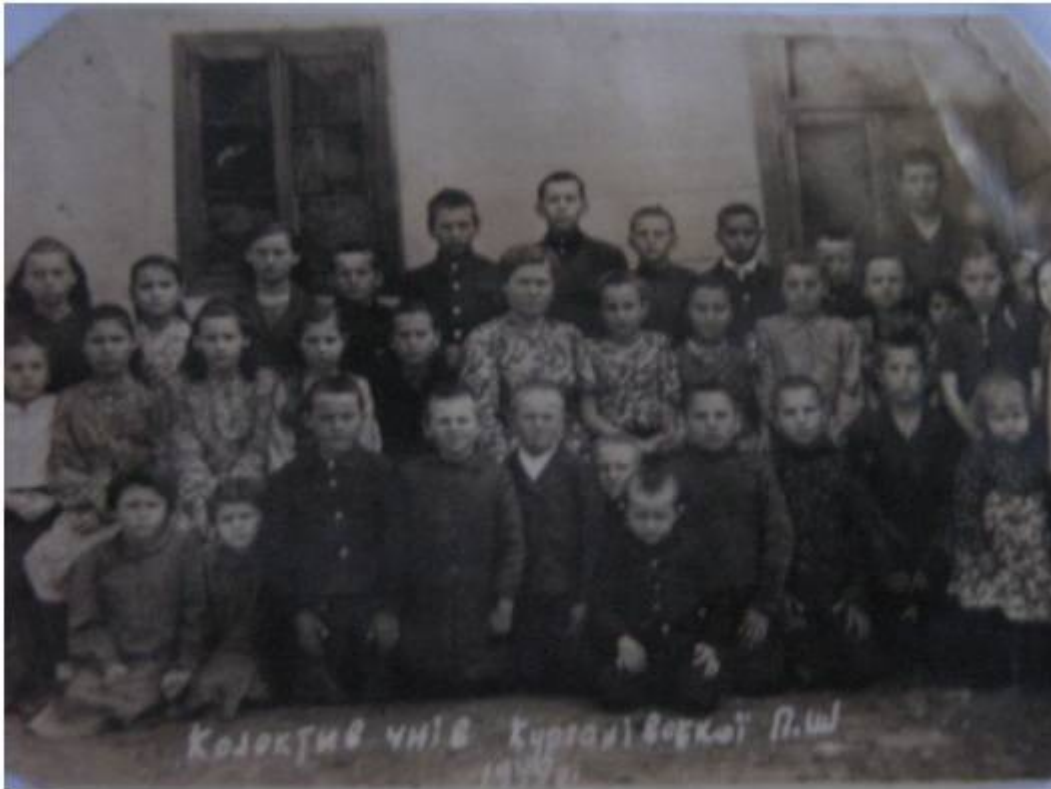
Колектив учнів Курганської польської школи 1949р.