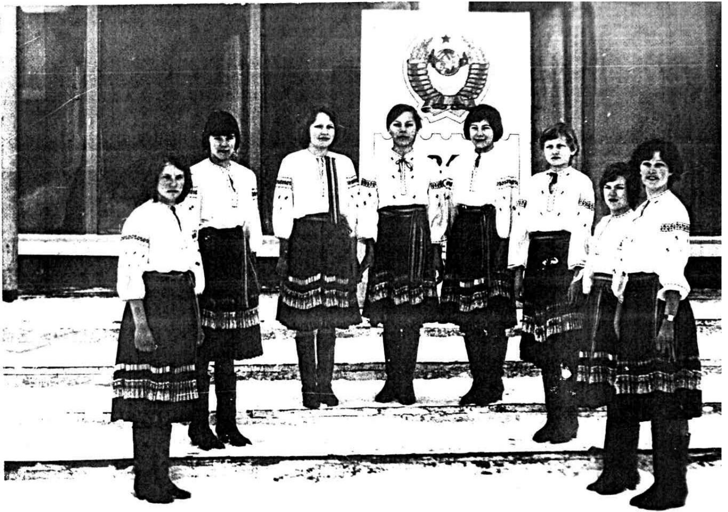
Агітбригада «Поляночка». 1984 рік.