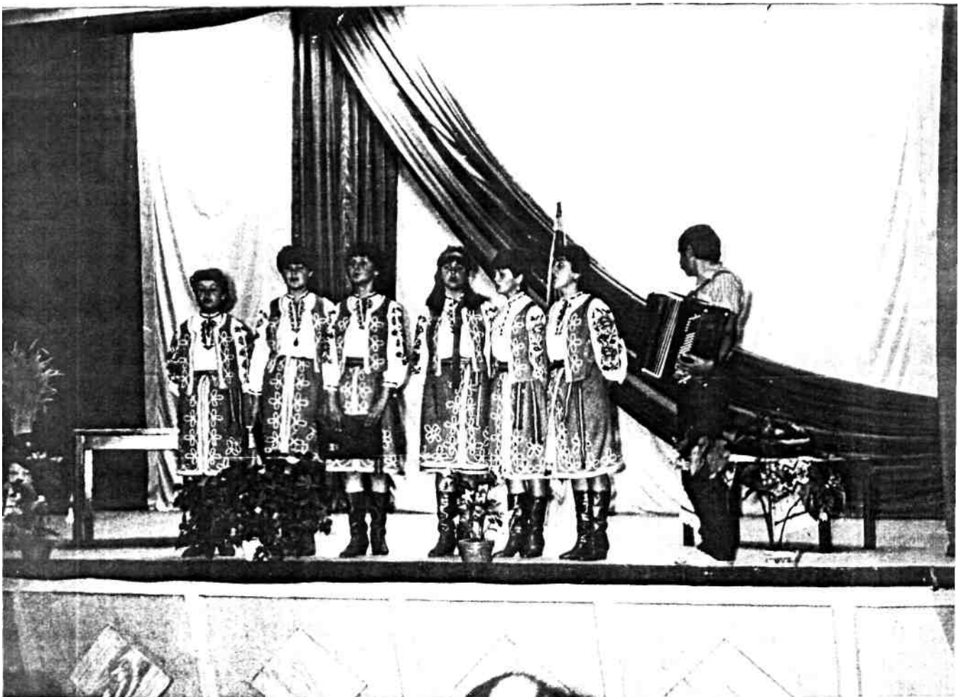
Хай лине пісня