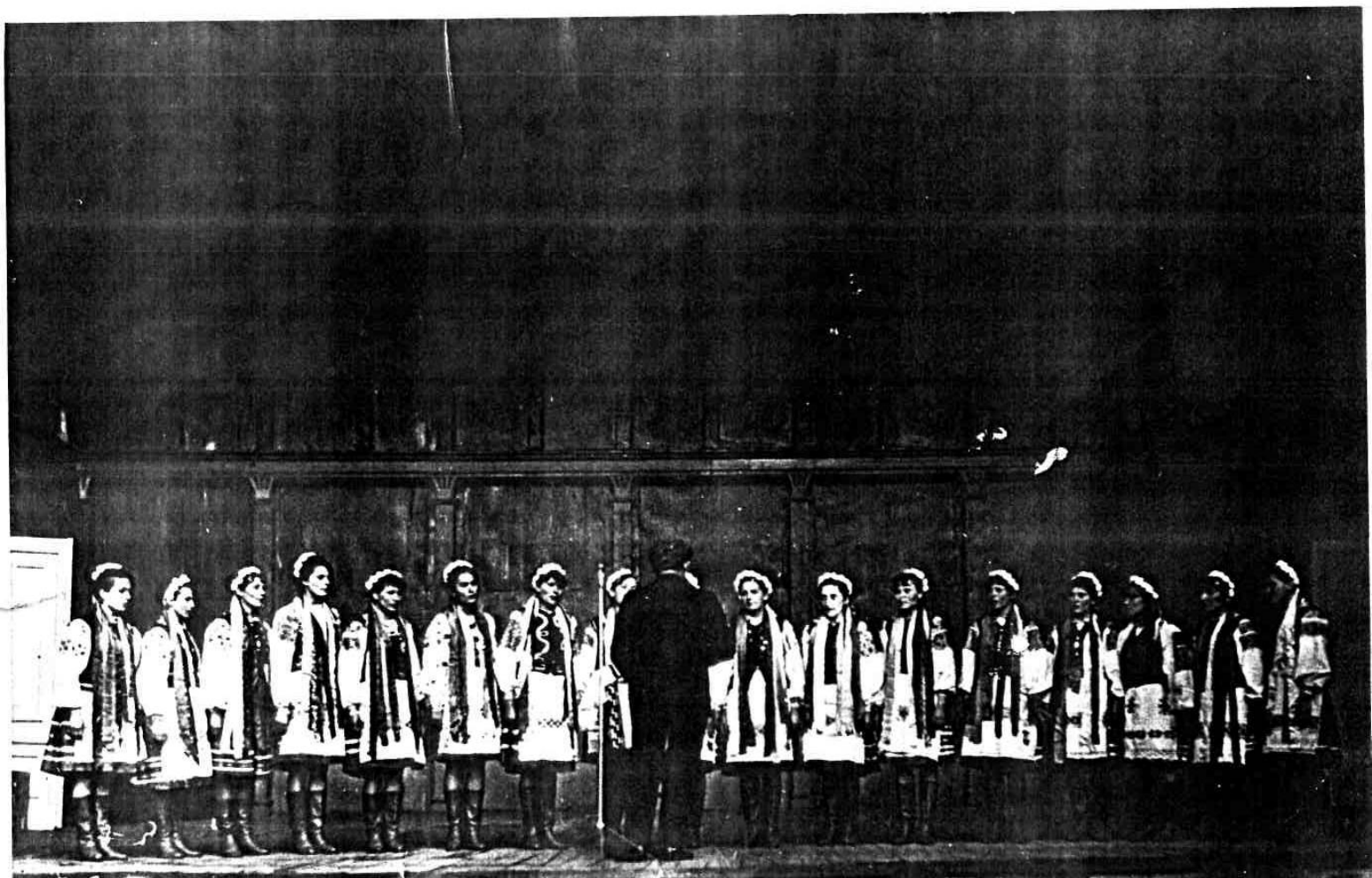
Виступ у драматичному театрі м. Рівне