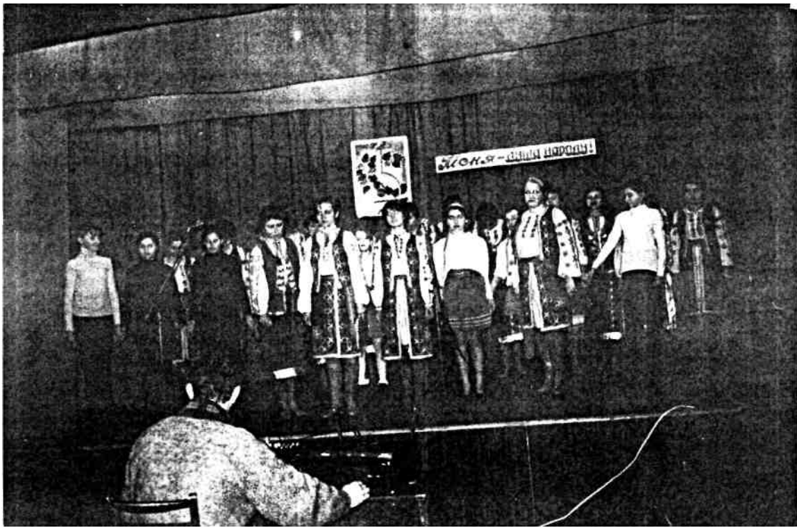
Звіт художньої самодіяльності 2008р.