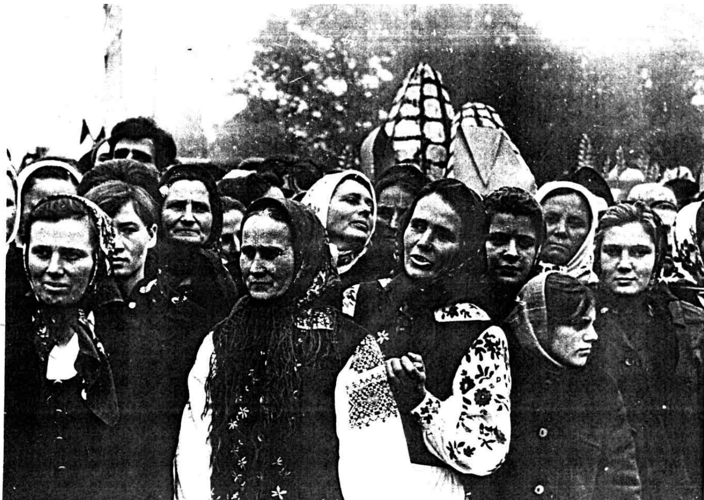
Урочисте відкриття Будинку культури