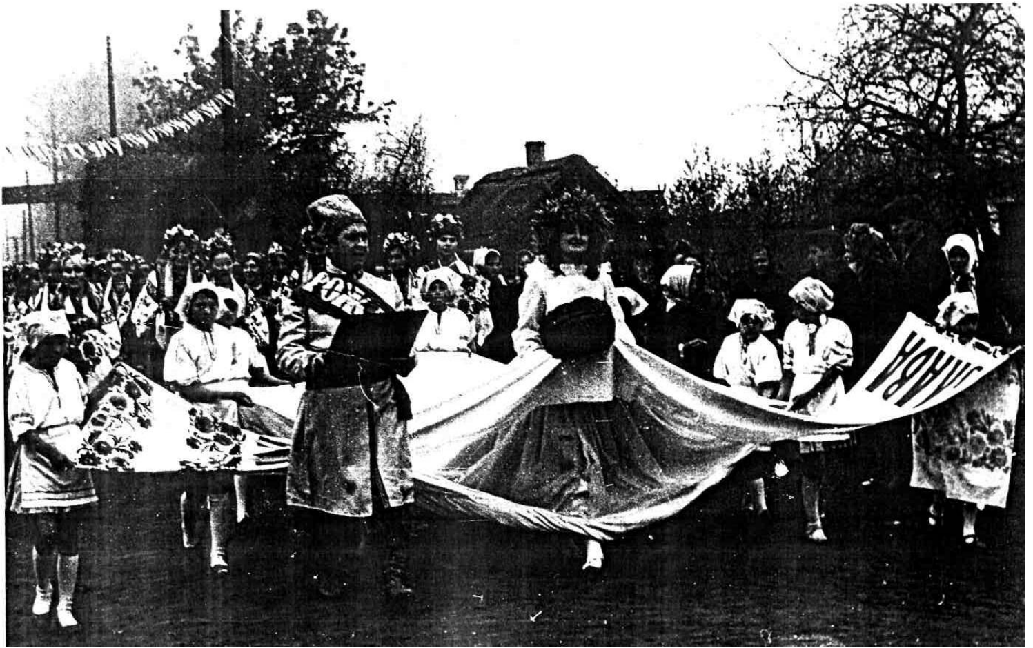
Свято врожаю 1970 рік.