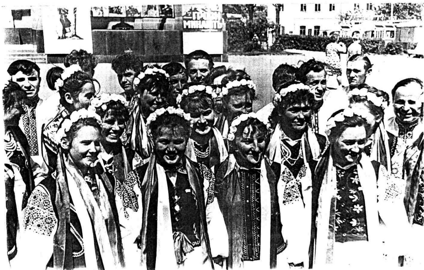
Фото на згадку