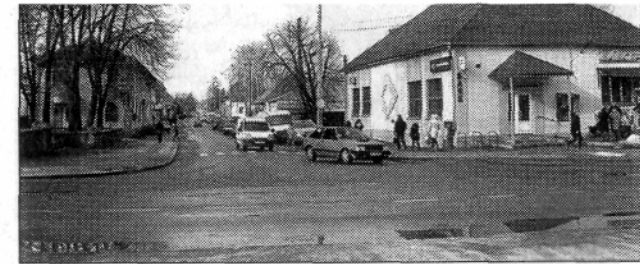
Колона мотоциклістів на роздоріжжі нинішніх вулиць Андріївської та Буховича в кінці 50-х років; цей куточок міста в наш час.

Але полишу ці не завжди солодкі спогади далекої юної пори та повернуся у наше сьогодні, щоб вкотре пройтися вулицею Андріївською, яка носить у собі колишню назву Березного, і подивитися на неї очима дорослої людини, що стоптала чимало підшов на центральній магістралі міста. Безперечно, протягом останніх ро-