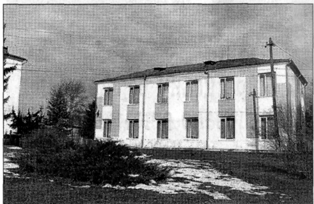
Вгорі – колишній млин; внизу — в його реконструйованому приміщенні нині працює дитяча музична школа.