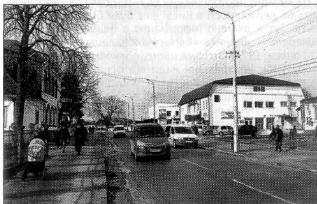
Центральна вулиця міста біля в'їзних воріт (рогаток) в далекому минулому; ці місця сьогодні.