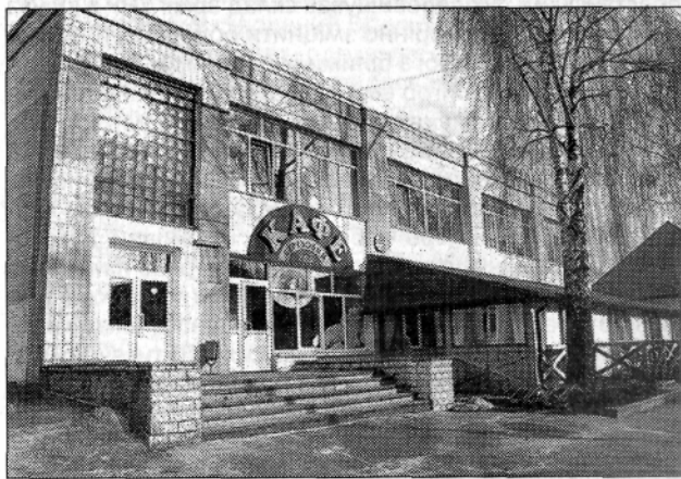
Місцева «Чайка» 50-60 років; на її місці функціонує сучасне кафе «Березовий гай».