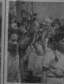
На фото: учні середньої школи №2 проходять повз трибуну.

навчання робити тих гуртків, що є в селі.