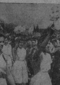
На фото: учні середньої школи №2 проходять повз трибуну.

свято. Під час його проведення вона продемонструвала свою готовність вчитися і працювати так, щоб бути гідною зміною старшого покоління.