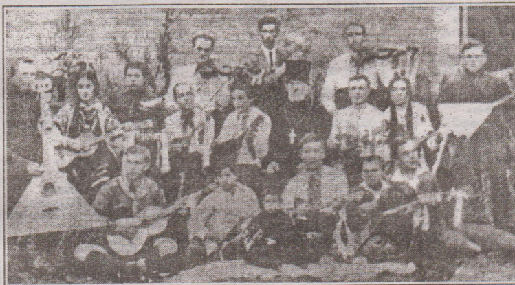
Аматорський струнний оркестр с. Дерев'яне. Фото 1927 р.

За книгою О.Цинкаловського «Стара Волинь і Волинське Полісся» (1934) Дерев'яне або Деревне, серед люду - Деревляне, Рівненський пов., 3 км. від Клевани і 28 км. від Рівного. Перші поселенці правдоподібно були деревляни, котрих оселив там один з пересопницьких князів. У 1887 р. було там 85 «димів» і 678 жителів, дерев'яна церква Троїцька (1846), на місці, де була стара, збурена Чарторийськими. У 1448 Дерев'яне належало князю Михайлу Чарторийському. Село це було надзвичай розлогим. У 1577 р. село належало до Клевани, княгині Іванової Чарторийської, котра платила з Дерев'яного від 25 «димів», 8 «городні» і 7 «городні».