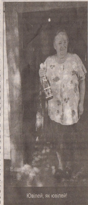
Ювілей, як ювілей!