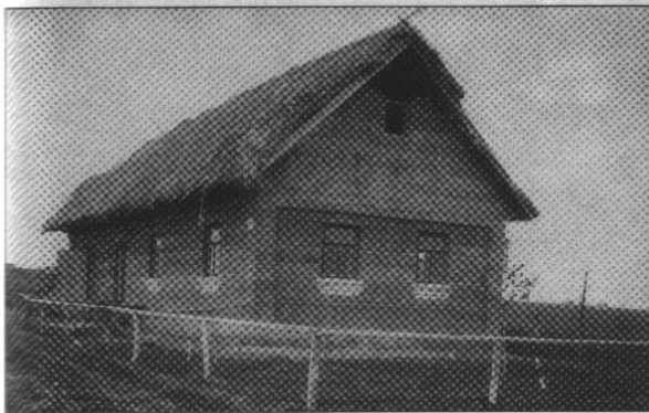
Солом'яна хата в с. Гориньград. Фото. 20-ті рр. XX ст.

Давнє наймення Крупа (Крупов'є) довго існувало в мові односельчан. Нові власники містечка Гориньград, родина князів Четвертинських, примушували жителів називати містечко новою назвою. З родиною князів Четвертинських пов'язаний такий народний переказ про одну із назв села в минулому. В одного із князів була дуже вродлива, кажуть одні, донька, а друг дружина, а треті — коханка, яку звали Ольга. Але сталося лихо: купалася пані в річці і втопилася. Довго оплакував князь рідну людину і наказав поховати молоду красуню в мурованій могилі (склеп-гроті). Старші жителі згадують, що містечко довго називали Оленгрот чи Оленград, або Олінгрод.