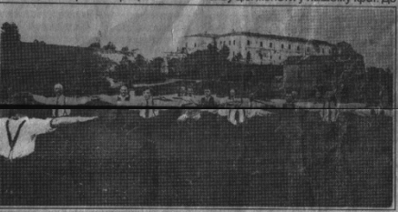
Заняття з гімнастики неподалік Клеванського замку, 20-ті рр.