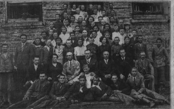
Учні та вчителі Клеванської школи, 30-ті рр.