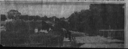
Дорога із Застав'я в Клевань через міст на р.Стубла, 60-ті рр.

іранська драхма VI століття, епохи династії Сасанідів. Ця династія правила на Близькому та Середньому Сході в III-VI століттях і стояла на чолі могутньої держави. Виходить, що в ті часи вже існували торговельні зв'язки між такими далекими народами. Інше ще можна пояснити тут появу цієї монети у нашому краї. До